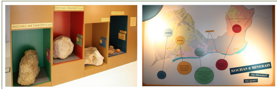
Figura 2. Fotografias do módulo “As rochas em que tropeço” e do mapa presentes no CIEC

O facto deste recurso existir dentro da própria escola, não poderá deixar de ser integrado aquando da exploração desta temática pelos professores com as suas crianças. Da mesma forma outros módulos existentes no CIEC, tais como, a tenda da arqueologia e paleontologia também devem ser rentabilizados para a exploração da temática das rochas e minerais.