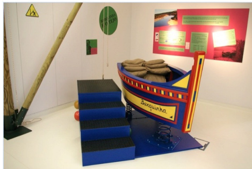
Figura 5. Fotografias do módulo “Mantém a barca em equilíbrio!”