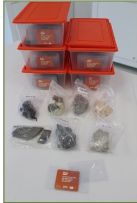
Figura 1. Kits de rochas organizados pelos PF

Posteriormente, promoveu-se a exploração de um conjunto de amostras de mão de rochas, nomeadamente quanto à sua origem, classificando-as em sedimentares, magmáticas ou metamórficas. Esta parte da exploração teve como objetivo aprofundar o conhecimento de conteúdo disciplinar dos PF e não ser uma proposta de abordagem com as crianças do 1.º CEB.