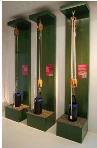
Figura 4. Fotografias do módulo “Testa a tua força!”

Sessão IV — Iniciou-se esta sessão relacionando a temática “rochas e minerais” com as “rampas, alavancas e roldanas”, nomeadamente no uso destas máquinas simples para o transporte das rochas ao longo do tempo e para as içar nas construções. Depois de uma breve contextualização, visitaram-se os módulos do CIEC “Testa a tua força!” ( Figura 4 ) e “Mantém a barca em equilíbrio!” ( Figura 5 ), onde foram contextualizadas novamente as relações entre as temáticas desta formação.