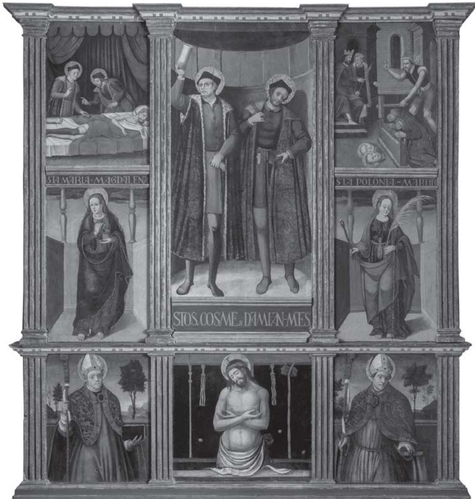
Retaule dels sants Cosme i Damià, Acaci Hortonedà, vers 1624. Procedent del Monestir de la Serra de Montblanc. Fundació Privada Mascort, Torroella de Montgrí.