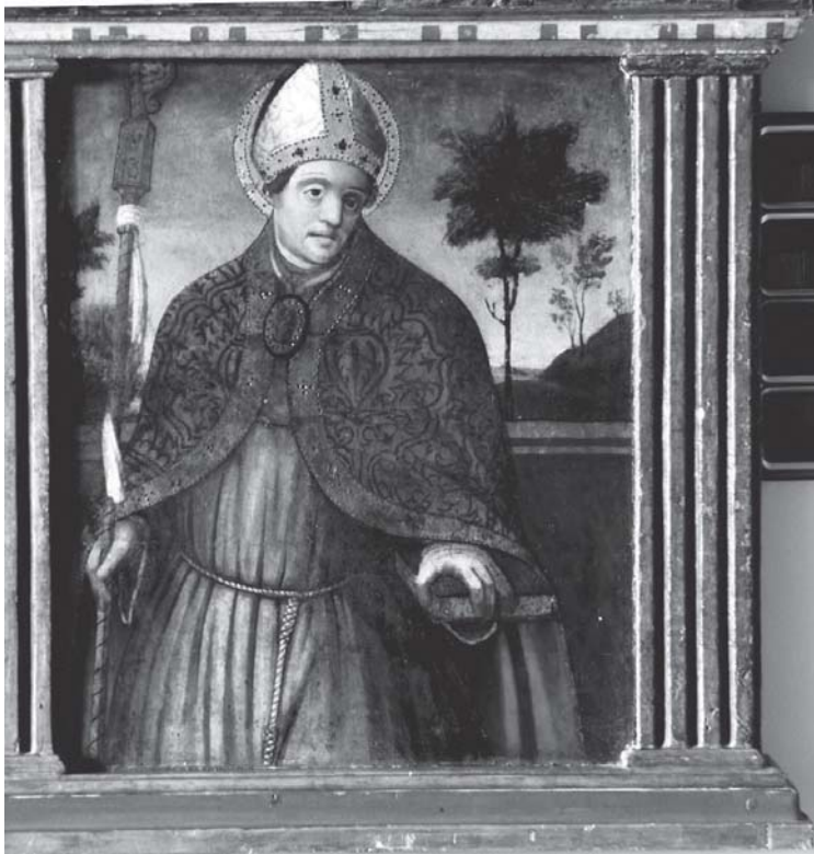
Detall de sant Lluís, bisbe de Tolosa de Llenguadoc.

La taula simètrica de la dreta representa santa Apol·lònia d'Alexandria. Verge i màrtir, va ser lapidada a causa de la seva fe cristiana. La Llegenda Àuria assegura que el botxí li va arrencar també les dents amb unes tenalles. Patrona dels dentistes i dels que pateixen mal de queixals, el seu atribut són unes tenalles amb què sosté una dent. 29 Vestida amb túnica i mantell, sosté també la palma del martiri i es mostra en un àmbit idèntic al de santa Maria Magdalena. A la part superior el rètol la identifica: S(an)TA (A)POLONIA – MARTIR.