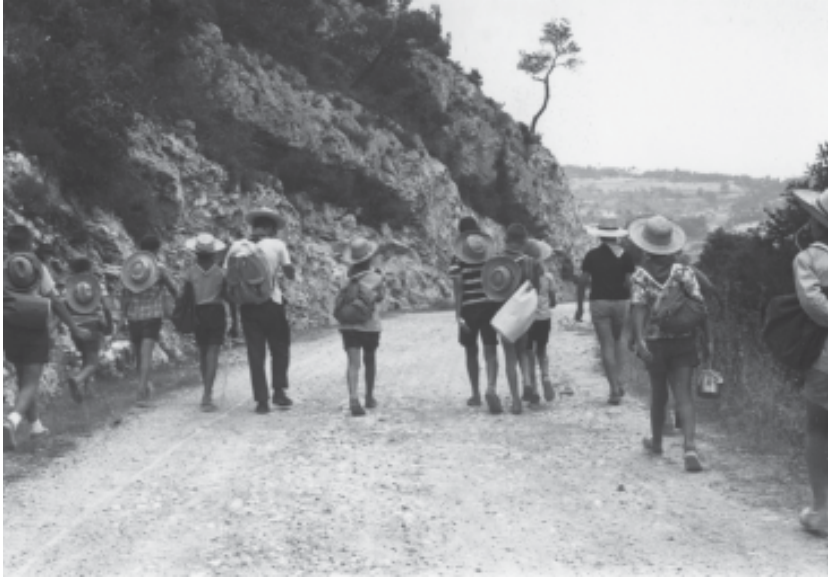
Sortida d'excursió al Castell de Queralt (1962).

gaudir amb coses ben senzilles. Deixant de banda la rigidesa de la doctrina que imperava en l'Església oficial, a l'entorn d'aquesta mateixa institució vàrem trobar-hi moments molt bons: el cinema infantil, els Pastorets, excursions, jocs, les vetllades al Centre Catòlic.... sens dubte allí hi havien persones que donaven allò que tenien de la millor manera que sabien o podien.