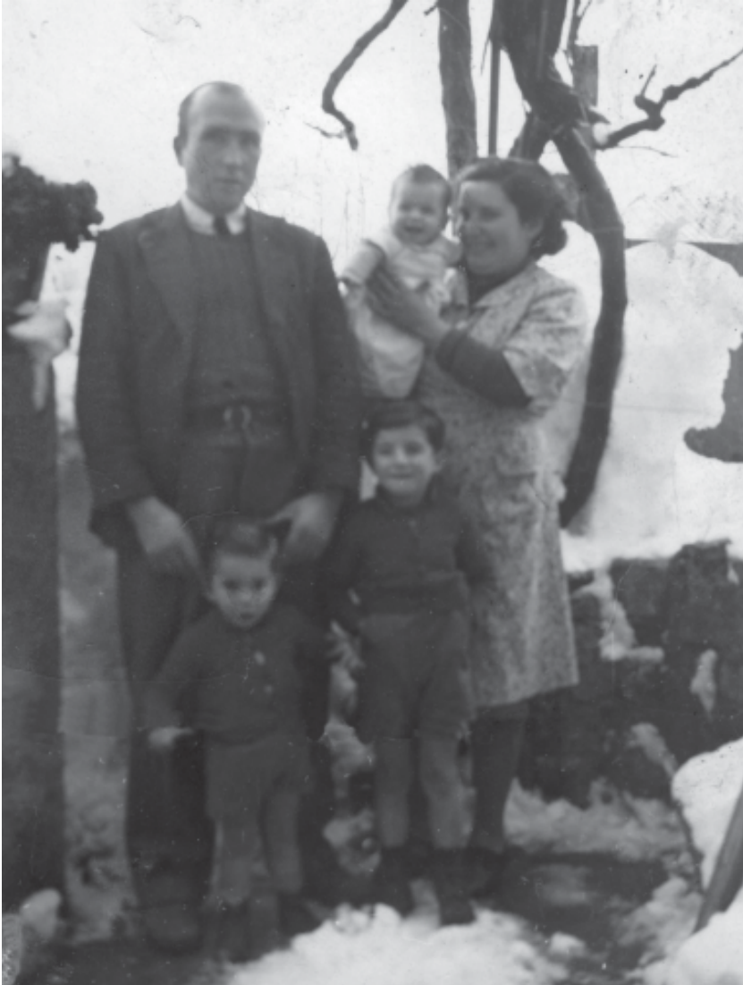
Amb els pares i germans. Febrer de 1944.