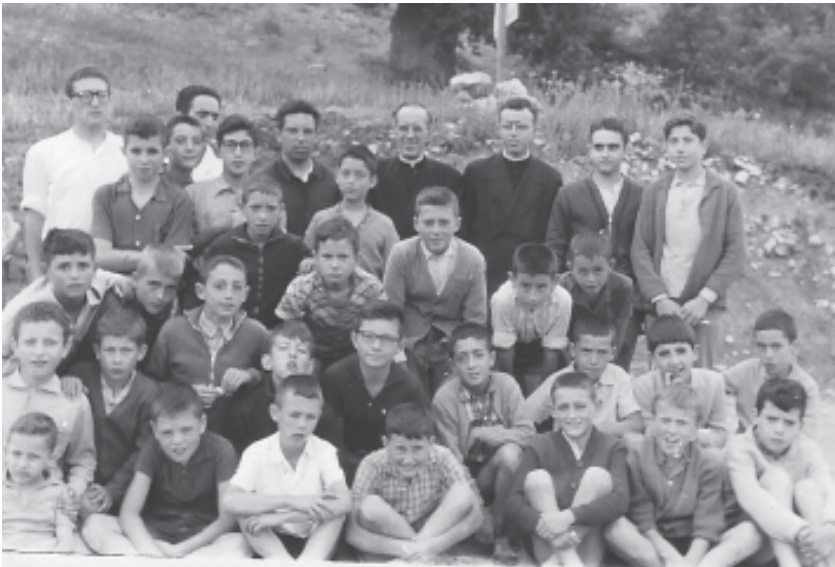
Colònies a Sant Magí de la Brufaganya. Sortida d'excursió (1961).

Val a dir que el poder d'adaptar-se a les circumstàncies dels infants és gran, i amb els amics (en un poble vivíem molt al carrer), sabíem