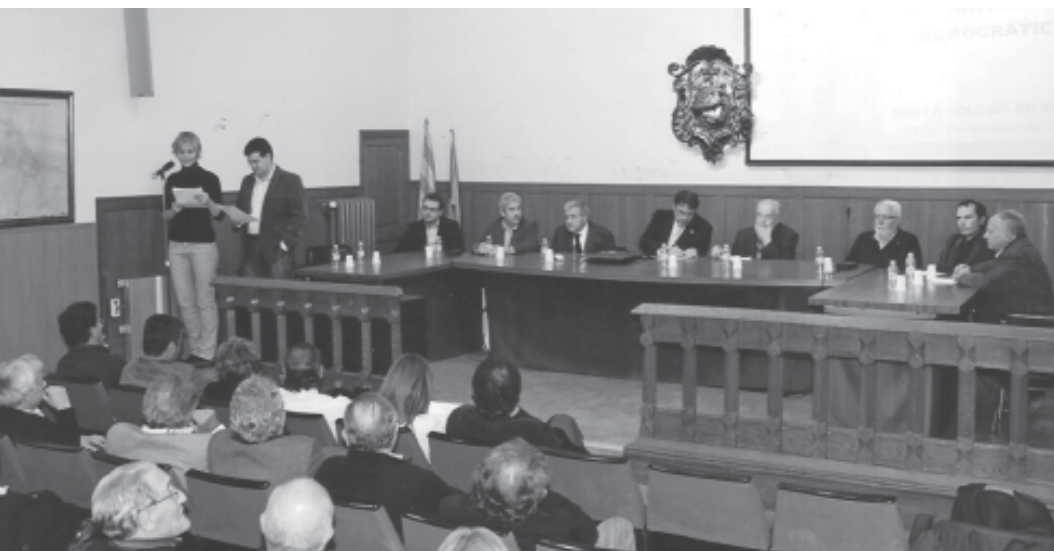
Santa Coloma de Queralt. Sessió plenària de l'Ajuntament amb motiu dels 30 anys d'ajuntaments democràtics (2009).

CiU tenia el poder amb majoria absoluta i podia presentar l'esquer de l'obra feta, mentre que a l'Ajuntament l'oposició era relegada a les tenebres i si alguna cosa feia era nosa. El 2003, però, suposà un canvi de tendència, ja que després de 23 anys de predomini de CiU, entrava al govern un «tripartit» format pels independents de la FIC, ERC i PSC. Els intents de canvi d'aquests quatre anys varen fracassar en part per dissensions internes i en part pels entrebancs de tota mena posats per altres institucions de govern, sempre en mans de CiU, que el 2007 recuperava el govern municipal.