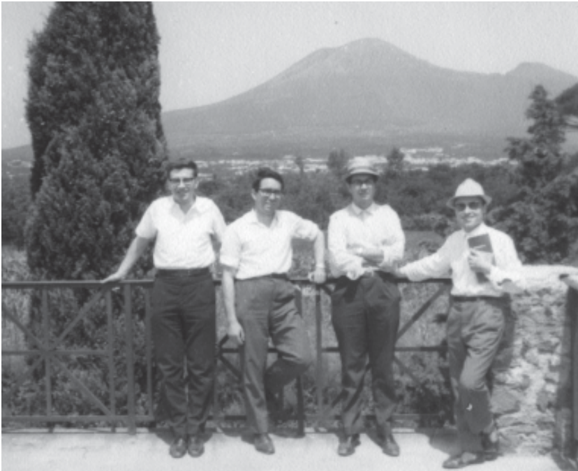
Roma. Visita a Pompeia (al fons el Vesuvi), juny de 1966.