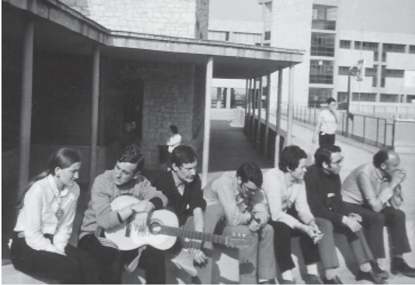
Tarragona, col·legi de Sant Pau (1968).

eclesiàstica que es resistia a aplicar els canvis establerts per la doctrina del concili Vaticà II. El món clerical seguia ofegant-se amb una legislació obsoleta i caduca. Era clar que no hi havia voluntat de canvi i per a molts el Concili era més una nosa que no pas una orientació. Altra vegada l'entorn es feia petit.