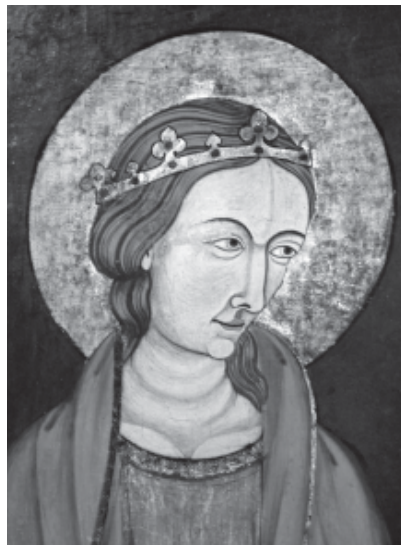
Foto 6.- Pintura de Santa Tecla a les portes del reliquiari, damunt del monument de Joan d'Aragó.