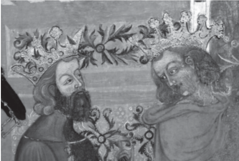
Foto 3.- Dos reis de l'Epifania, al retaule de Paret Delgada. Obra de Joan de Tarragona.