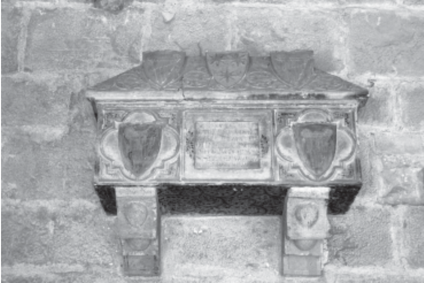
Foto 11.- Ossari de la família Alanyà.