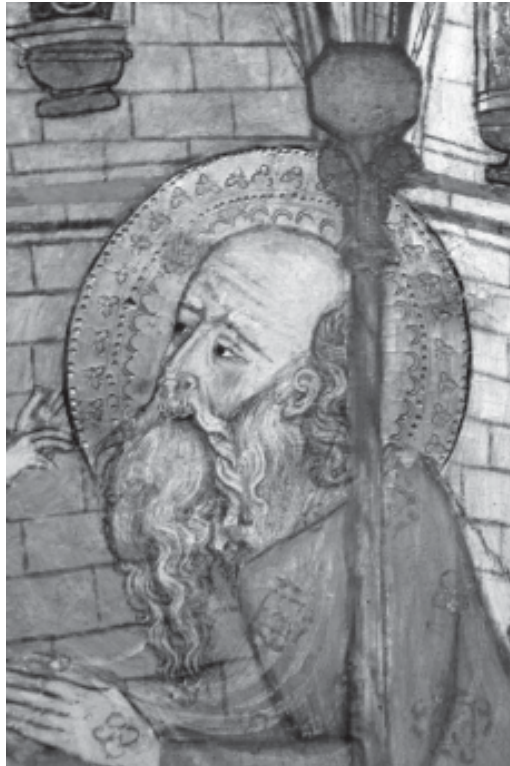
Foto 1.- Simeó a la Presentació al Temple, del retaule de Paret Delgada (La Selva del Camp).

Creiem que podem ampliar el catàleg pictòric de Joan de Tarragona amb una nova obra, fent la seva atribució mitjançant els paral·lelismes estilístics amb la seva única obra documentada. Es tracta de les portes del reliquiari de Santa Tecla de la catedral de Tarragona, situades inicialment damunt del monument funerari de l'arquebisbe Joan d'Aragó, a l'absis del temple