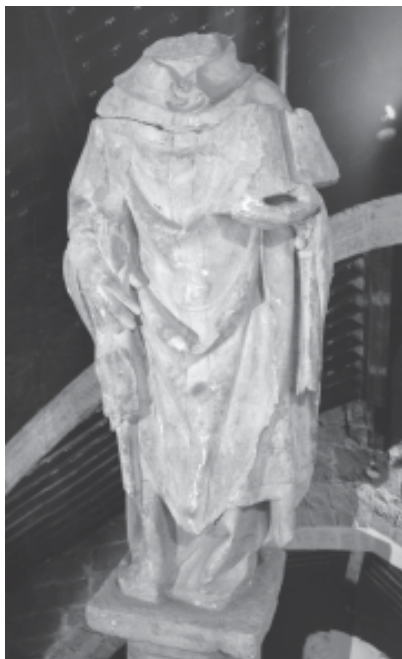
Foto 7.- Imatge d'un bisbe (Sant Ambrós) de l'antiga capella dels Quatre Doctors, a l'església de Sant Miquel de Montblanc.