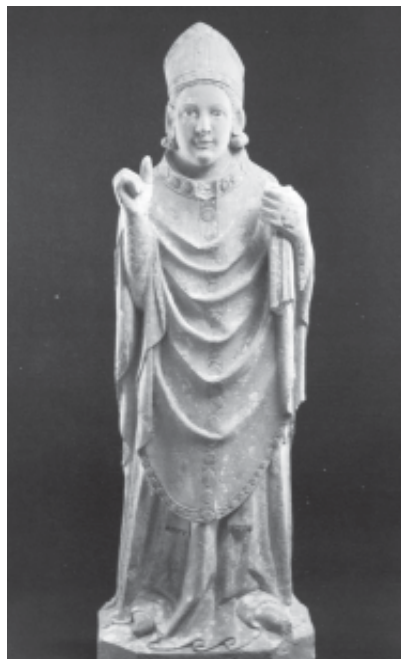
Foto 8.- Imatge de Sant Blai, del Fonoll.