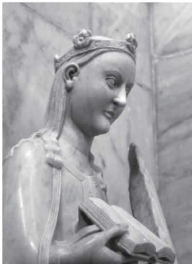
Foto 5.- Imatge de Santa Tecla al monument funerari de Joan d'Aragó.