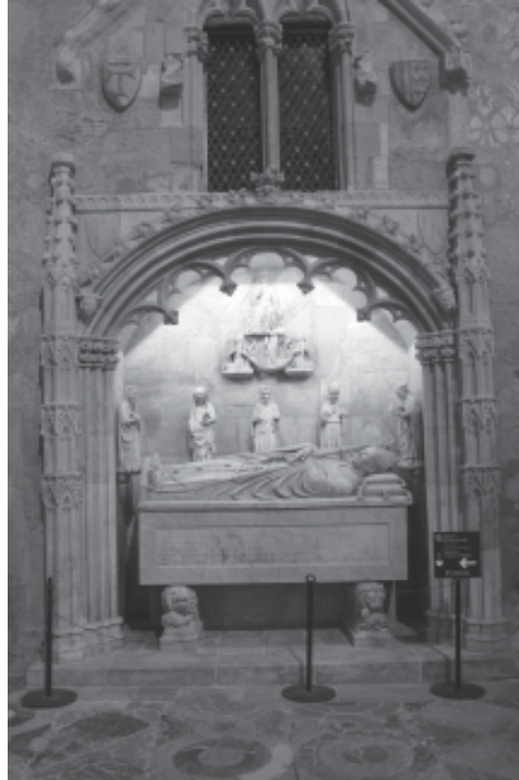
Foto 10.- Portada de la capella del Palau Episcopal de Tortosa (reproduït d'una postal antiga).