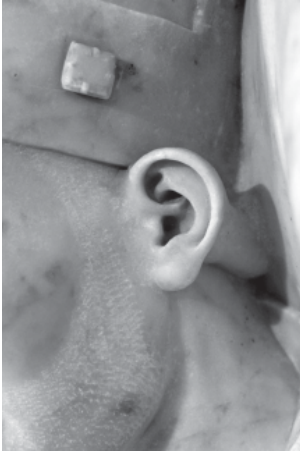
Foto 4.- Cap de l'escultura funerària de l'arquebisbe Joan d'Aragó, a la catedral de Tarragona. Detall de l'orella.

Joan d'Aragó amb l'armari o reliquiari de Santa Tecla, situat immediatament damunt seu, amb les seves portes pintades per fer de reconditori, haguessin estat construïdes per un mateix artista. I els paral·lelismes es poden continuar establint en altres aspectes: l'estructura decorativa del monument funeràri en pot ser un exemple, amb un arc carpanell amb l'intradós polilobulat com els arcs carpanells que decoren els compartiments inferiors del retaule de Paret Delgada, o l'extradós d'aquest arc del monument decorat amb fulles de card, de la mateixa manera que els arcs decoratius dels compartiments superiors del retaule selvatà; o la decoració en forma de sanefa vegetal de fulles de raïm ( Vitis vinifera ) dels llistons separadors dels compartiments del retaule de Paret Delgada, amb la decoració en forma d'orla o sanefa de fulles de raïm que rodeja la inscripció del frontal de la caixa del sarcòfag.