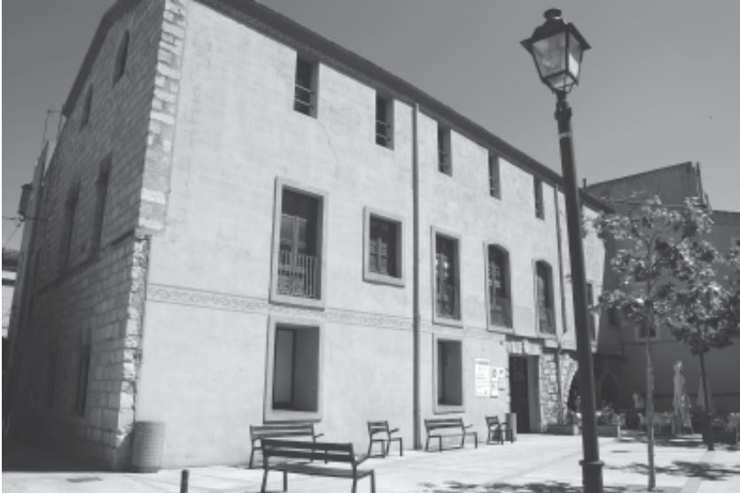
Vista de l'actual Casal d'Entitats, façana de Poblet i Teixidó.

Té una superfície de 1.265 m 2 construïts i 635 m 2 de terreny de sòl. És de titularitat municipal i està catalogat com a Bé Cultural d'Interès Local (BCIL).