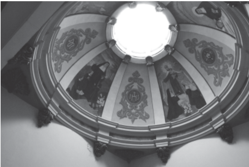
Cúpula de l'escala amb la decoració mural. Font: Àlex Rebollo, 2015.