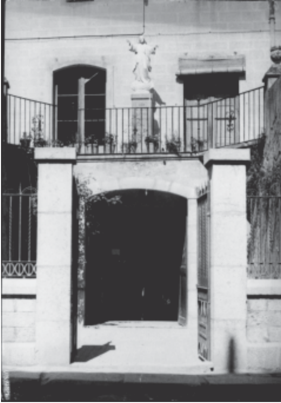
Entrada principal durant l'etapa d'escola de les Carmelites.