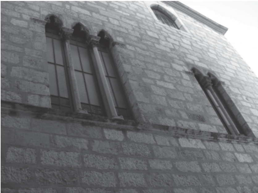
Finestres coronelles de la façana del carrer Sant Isidre.

En l'aspecte material és un exemple d'evolució arquitectònica típica de Montblanc, amb origen en el període medieval i modificacions posteriors. Des del punt de vista de la seva preservació i conservació caldria posar l'accent en la cúpula de l'escala i la seva decoració mural, aquesta necessitaria d'una banda, una intervenció de con-solidació i, d'altra banda, revisar i, si és possible, revertir els efectes de la mala restauració feta en el passat. Així mateix també seria bo consolidar altres elements significatius, com els finestrals de la primera planta de la façana del carrer Sant Isidre.