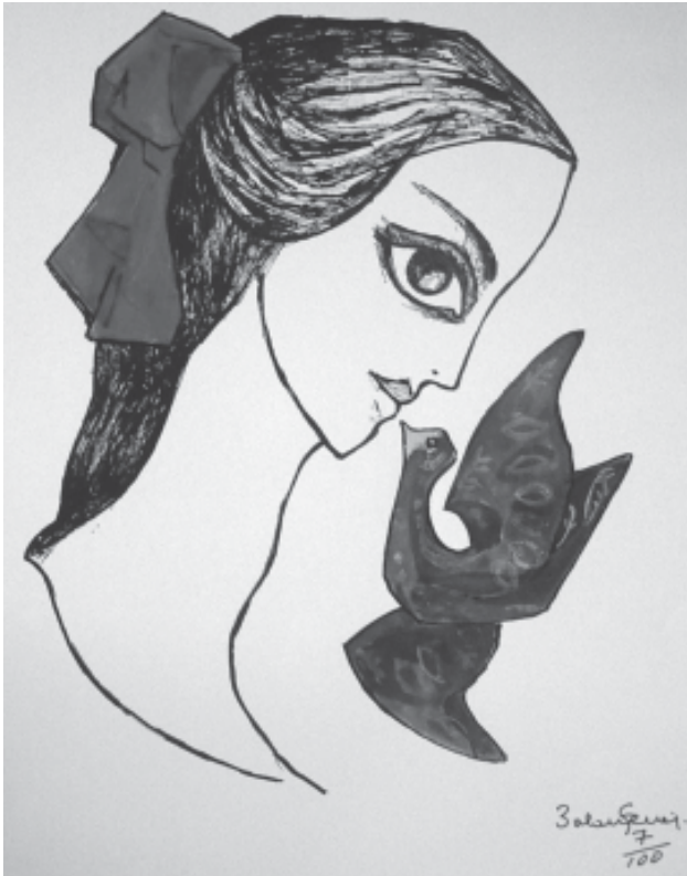
Palau Ferré. Noia amb colom . Tinta xinesa. (Col·lecció particular).

La coloma porta al bec un branquillonet de vida; joiosa, diu que l'ha tret del sublim art d'en Maties.