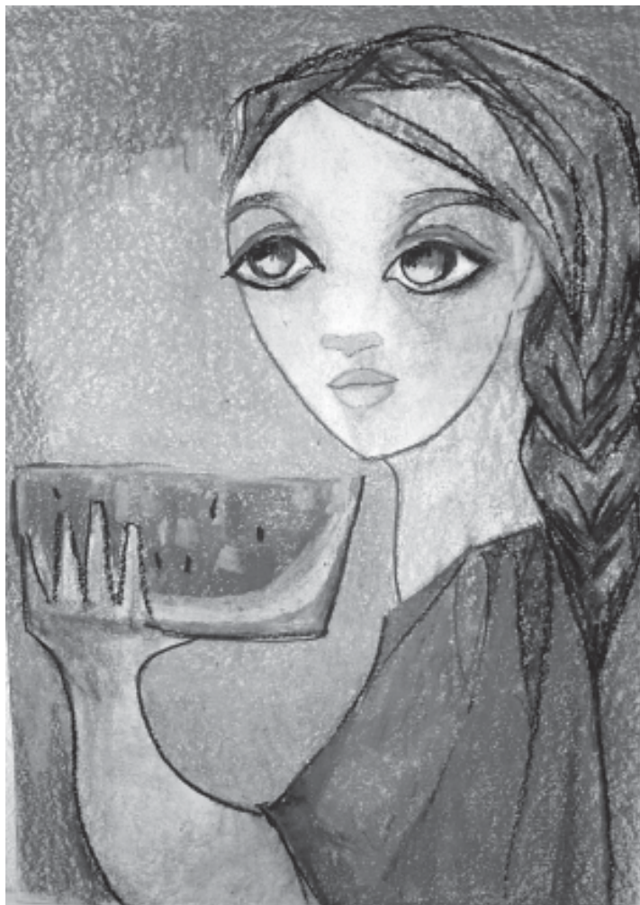
Palau Ferré. Noia amb síndria . Cera. (Col·lecció particular).

Ai, la dama d'ulls radiants subjectant un tall de síndria; en l'abelliment de mans el vermell gaudeix carícia.