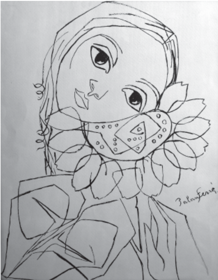
Palau Ferré. Noia amb gira-sol . Tinta xinesa. (Col·lecció particular).

De tulipa, gira-sol, margarida, rosa, lliri... cada gerro en fa bagol: cromatisme al seu cantiri.