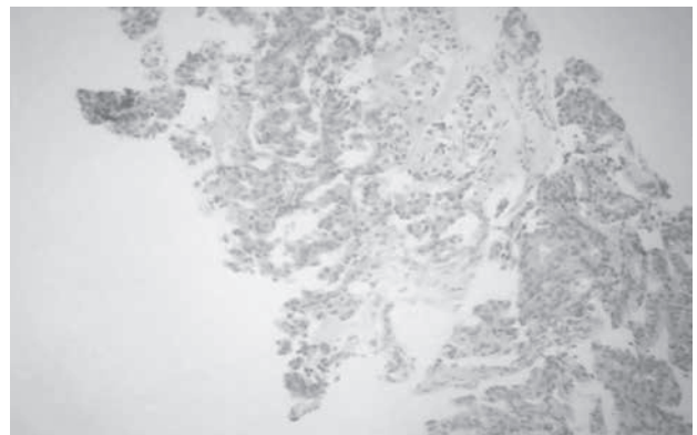
Figura 3. Microfotografía de piel de pene, en un aumento de 4x, en tinción de hematoxilina y eosina, se observan células claras monótonas, dispuestas en un patrón difuso, invadiendo la dermis superficial y profunda.