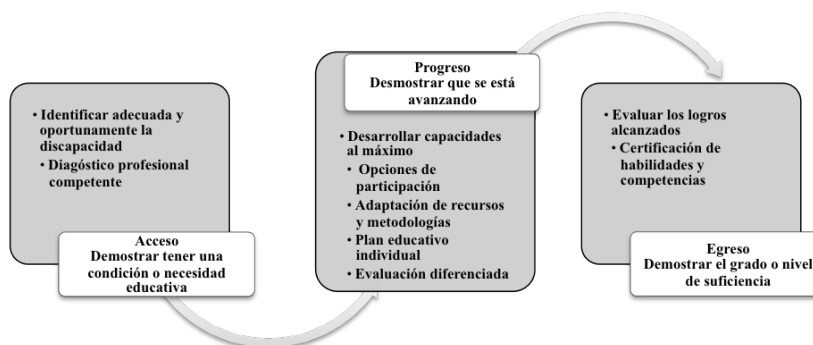
Figura 2: Cadena de recursos, actividades y resultados del proyecto

¿Cómo se cumple el objetivo de interés de la política a través de la larga, compleja y diversificada cadena de ejecución, involucrada en el proyecto de integración escolar? Los principales “recursos de las teorías” que provocan el efecto esperado por la intervención se desencadenan de la siguiente forma.