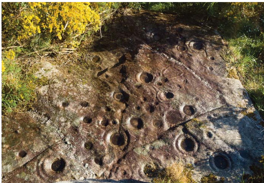
Foto 3. Panel núm. 1. Vista xeral desde o panel núm.3, o oeste.