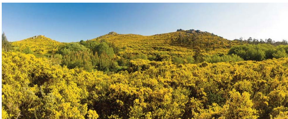
Foto 2. Vista do contorno desde o Panel núm. 1 1.