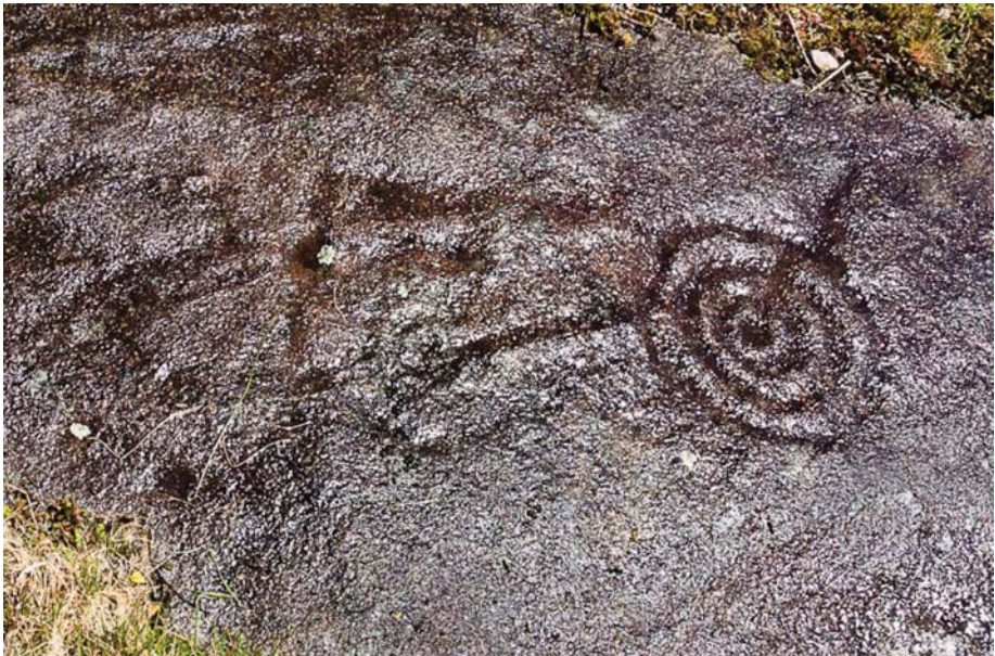
Foto 9. Panel núm. 4. Vista parcial dos motivos.