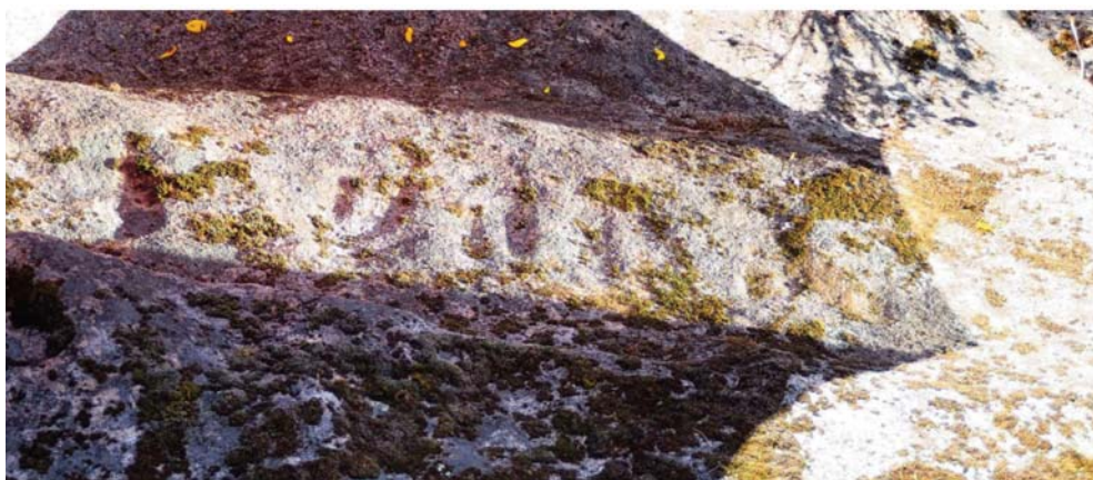
Foto 11. Detalle da inscrición do panel núm. 2.