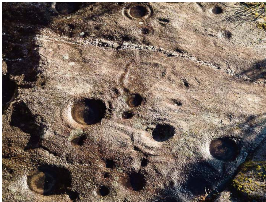
Foto 4. Panel núm. 1. Vista parcial dos motivos centrais.