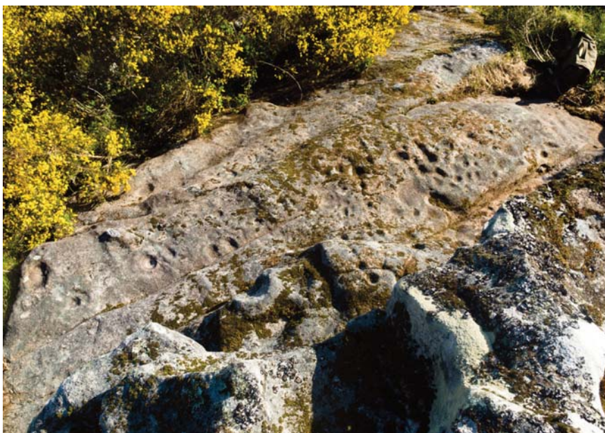
Foto 5. Panel núm. 2. Vista xeral desde o noroeste.