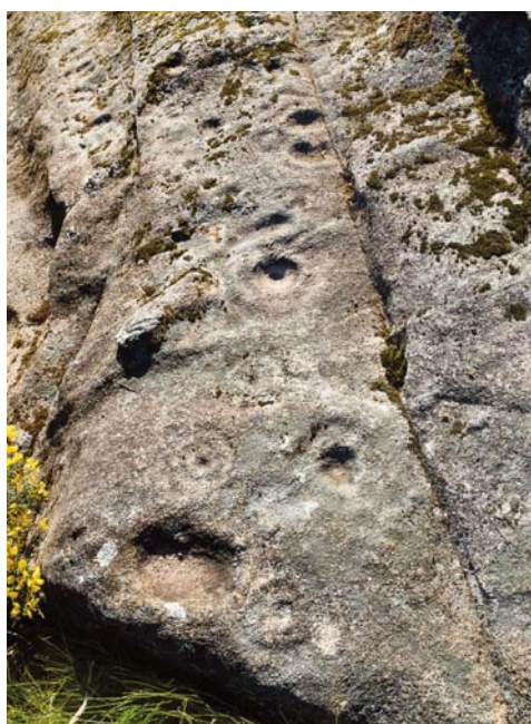
Foto 7. Vista parcial do Panel núm. 2