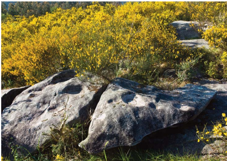
Foto 10. Vista parcial do Panel núm. 5