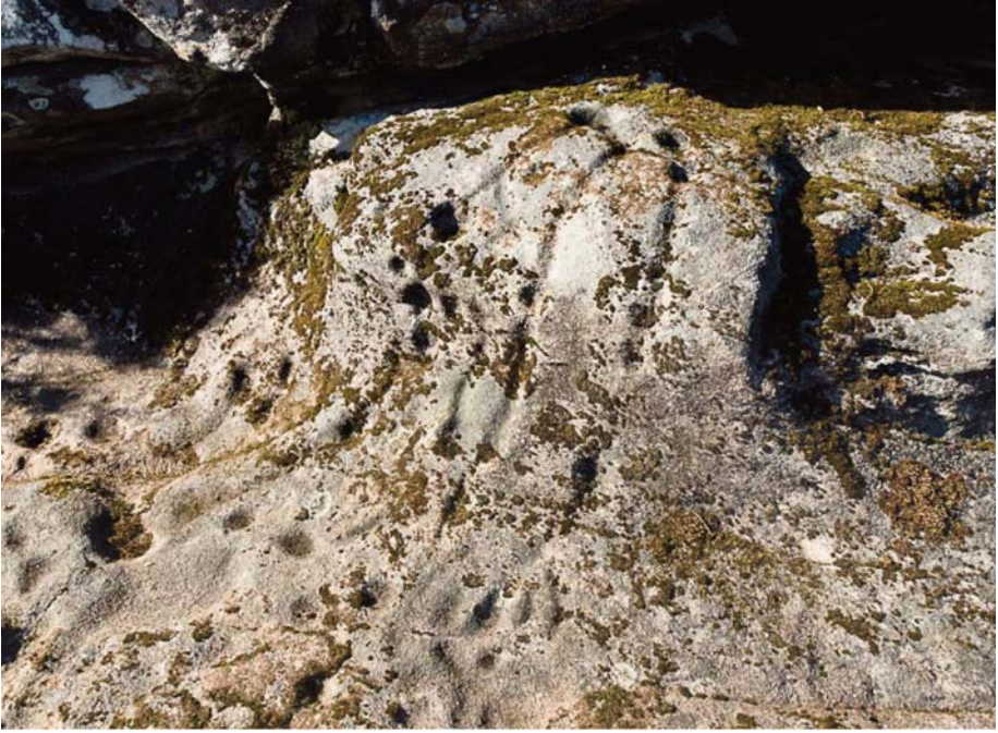
Foto 8. Vista parcial do Panel núm. 2. Sucos conectando motivos.