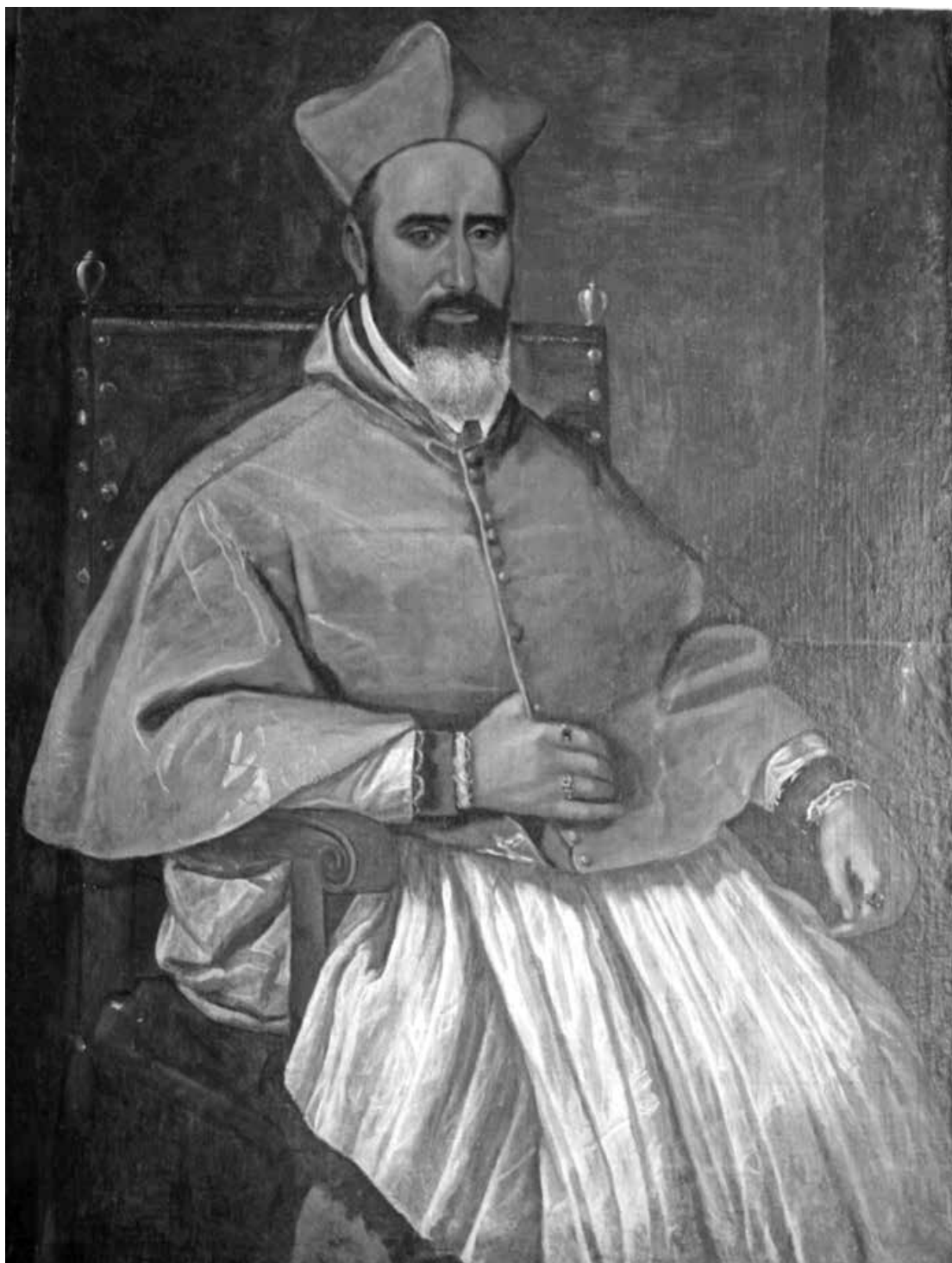
Figura 1. Autor anónimo. "Retrato Inédito" del Cardenal Fernando Niño de Guevara. Zaragoza, colección particular.

cuadros heredados por los familiares del cardenal han llegado a nuestros días en perfectas condiciones a diferencia del "Retrato Inédito". También las copias del Arzobispado de Sevilla del "Retrato Inédito" del cardenal están en buen estado.