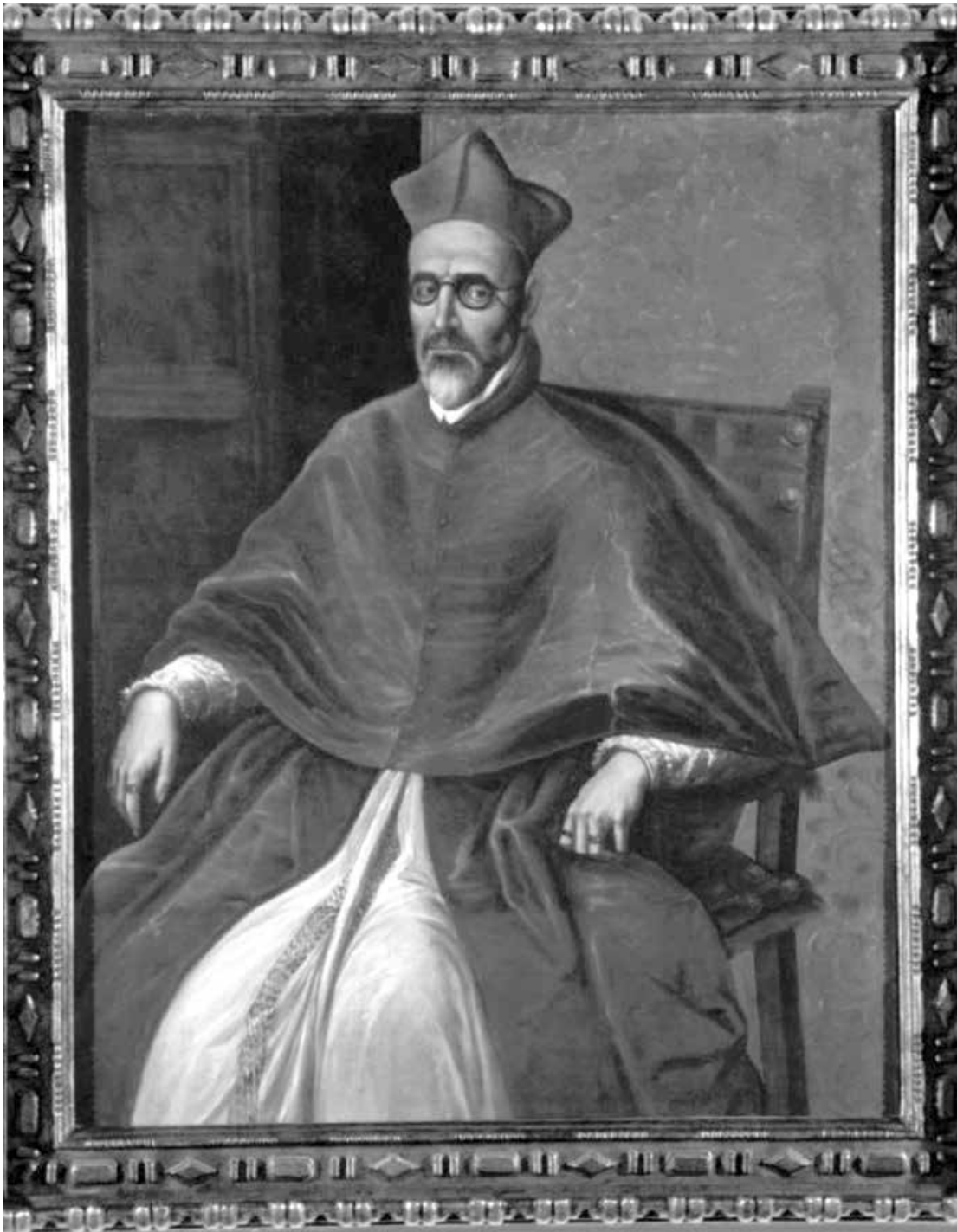
Figura 6. Luis Tristán. Retrato de Fernando Niño de Guevara, copia del retrato de El Greco. Toledo, Museo del Greco.