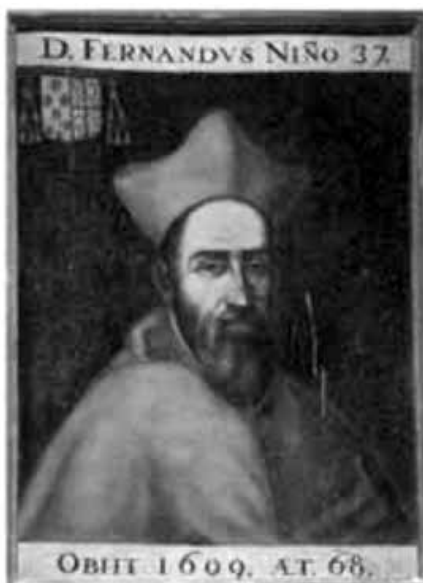
Figura 2. Autor anónimo. Retrato del Cardenal Fernando Niño de Guevara. Sevilla. Biblioteca Capitular del Arzobispado de Sevilla.