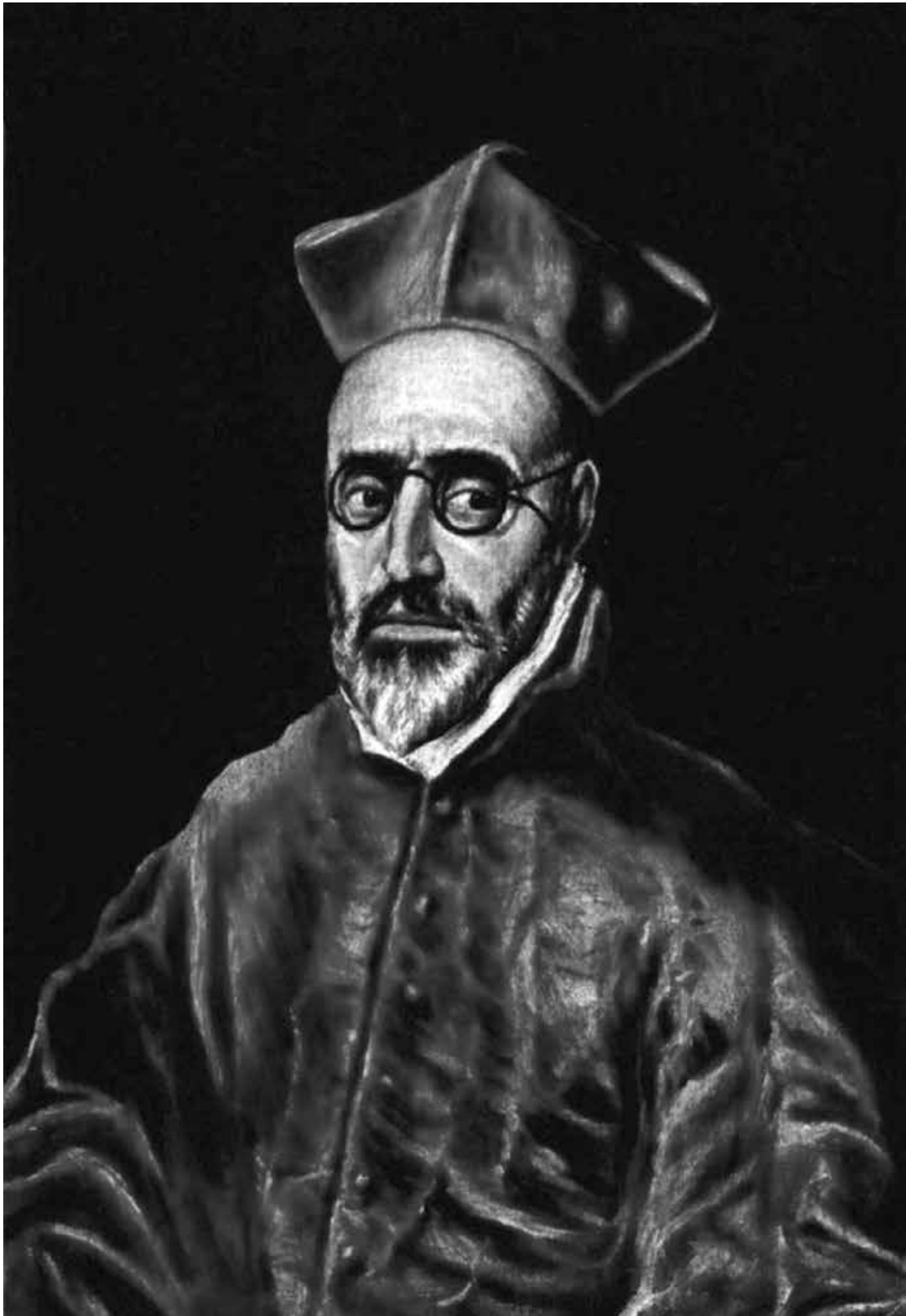
Figura 5. El Greco. Retrato de Fernando Niño de Guevara, réplica. Wintherthur, colección O'Reinhart.