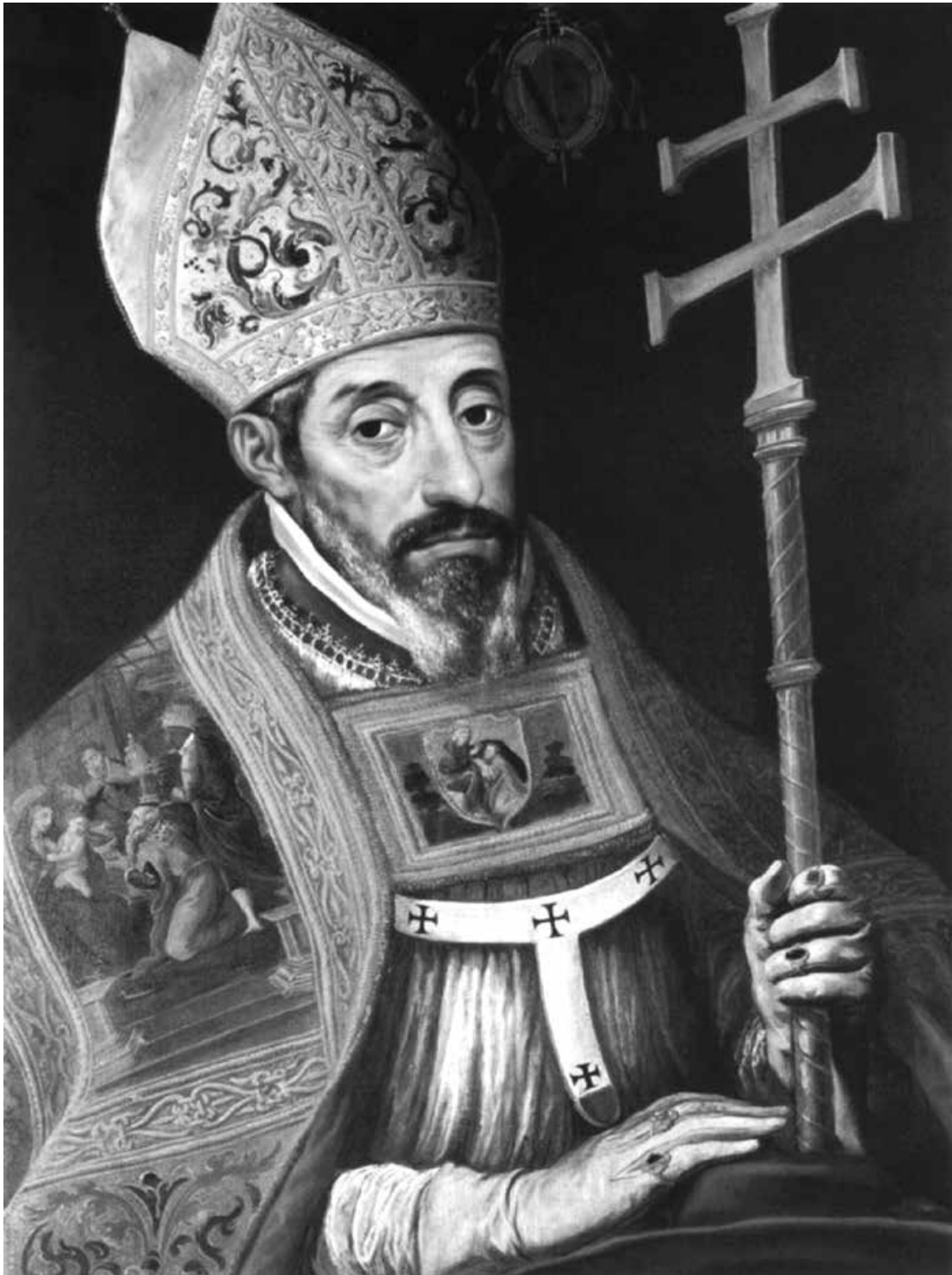
Figura 7. Luis Tristán. Retrato del Cardenal Bernardo Sandoval y Rojas. Toledo, Sala Capitular de la Catedral de Toledo.