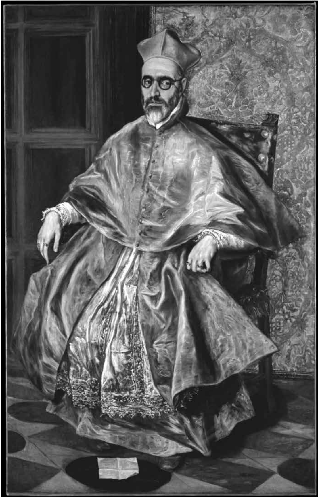
Figura 4. El Greco. Retrato de cuerpo entero de Don Fernando Niño de Guevara. Nueva York, colección del Museo Metropolitano de Arte.