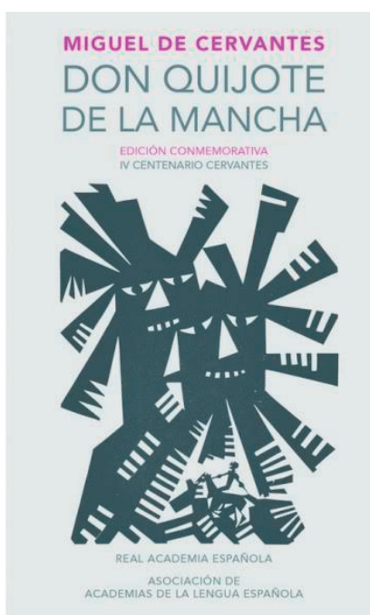
Imagen 1. Edición del Quijote, conmemorativa del IV centenario de Cervantes.

Para empezar, el hidalgo Don Quijote presentaba en su cuerpo un característico lunar pardo recubierto por ciertos cabellos a modo de cerdas (ne-