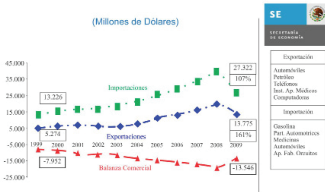
GRAFICA 1 Evaluación del TLCUEM a 10 años Secretaría de Economía (2010)

A continuación de muestra un análisis de 10 años realizado por la SE teniendo en cuenta el Tratado y sus aspectos principales.