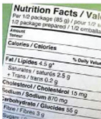
ILUSTRACIÓN 2 Ejemplo de una NOM de etiquetado

Una NOM es una norma de regulación técnica de observancia obligatoria expedida por las dependencias, conforme a las finalidades señaladas, que establece reglas, especificaciones, atributos, directrices, características o prescrip-