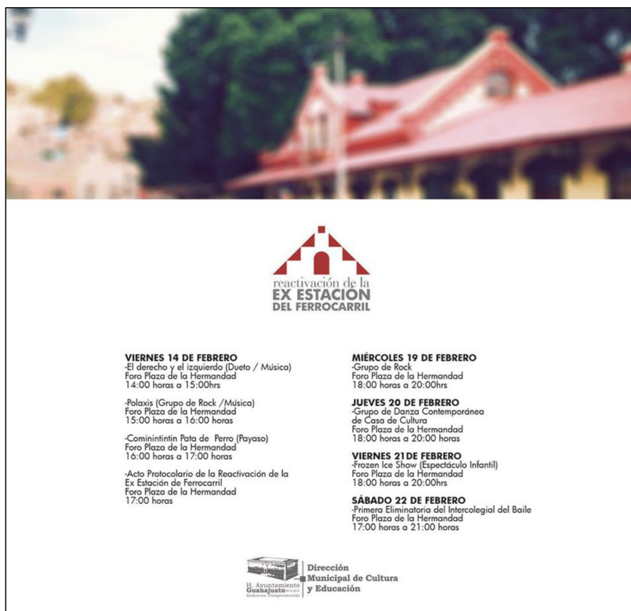
Figura 1. Cartelera cultural de febrero 2014 en la Ex Estación del Ferrocarril

Una programación similar se ha realizado en la Plazuela del Baratillo y en la Plaza de la Hermandad de la Ex Estación del Ferrocarril con motivo de reactivar la afluencia de clientes a los negocios circundantes, por lo que se han efectuado eventos infantiles, clases de zumba, intercolegial de baile, conciertos de rock, y música de banda, pensando en el poder que tienen estas formas de diversión para convocar y movilizar oleadas de habitantes por un espectáculo efímero. Ver figura 1