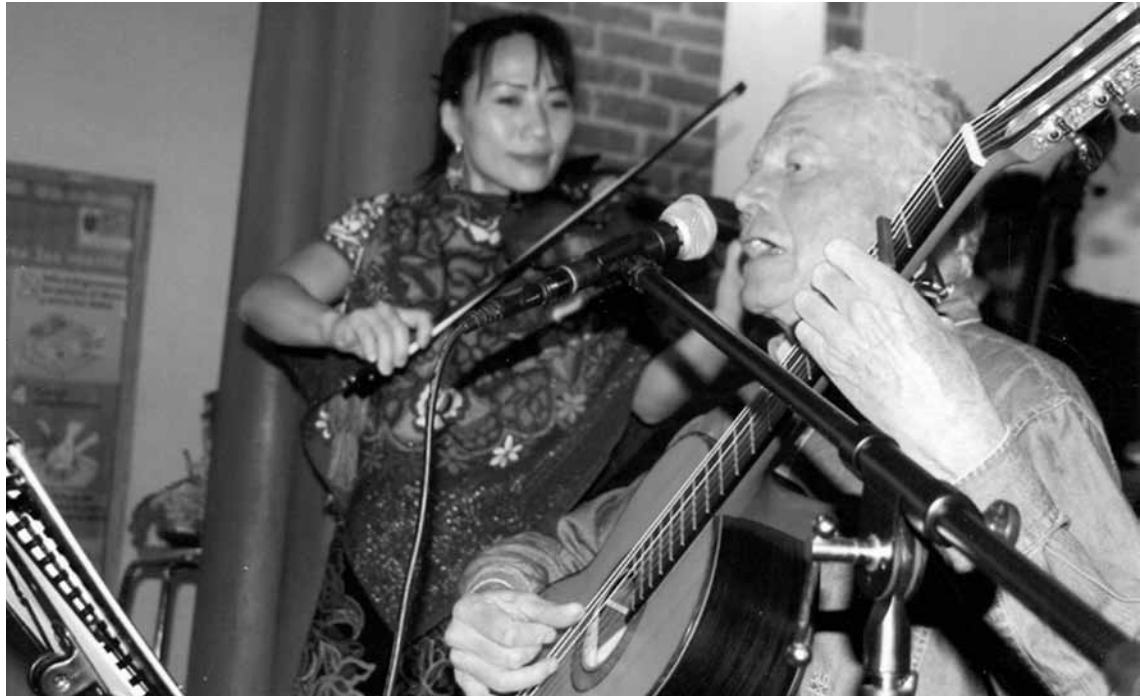
El músico, 2011.