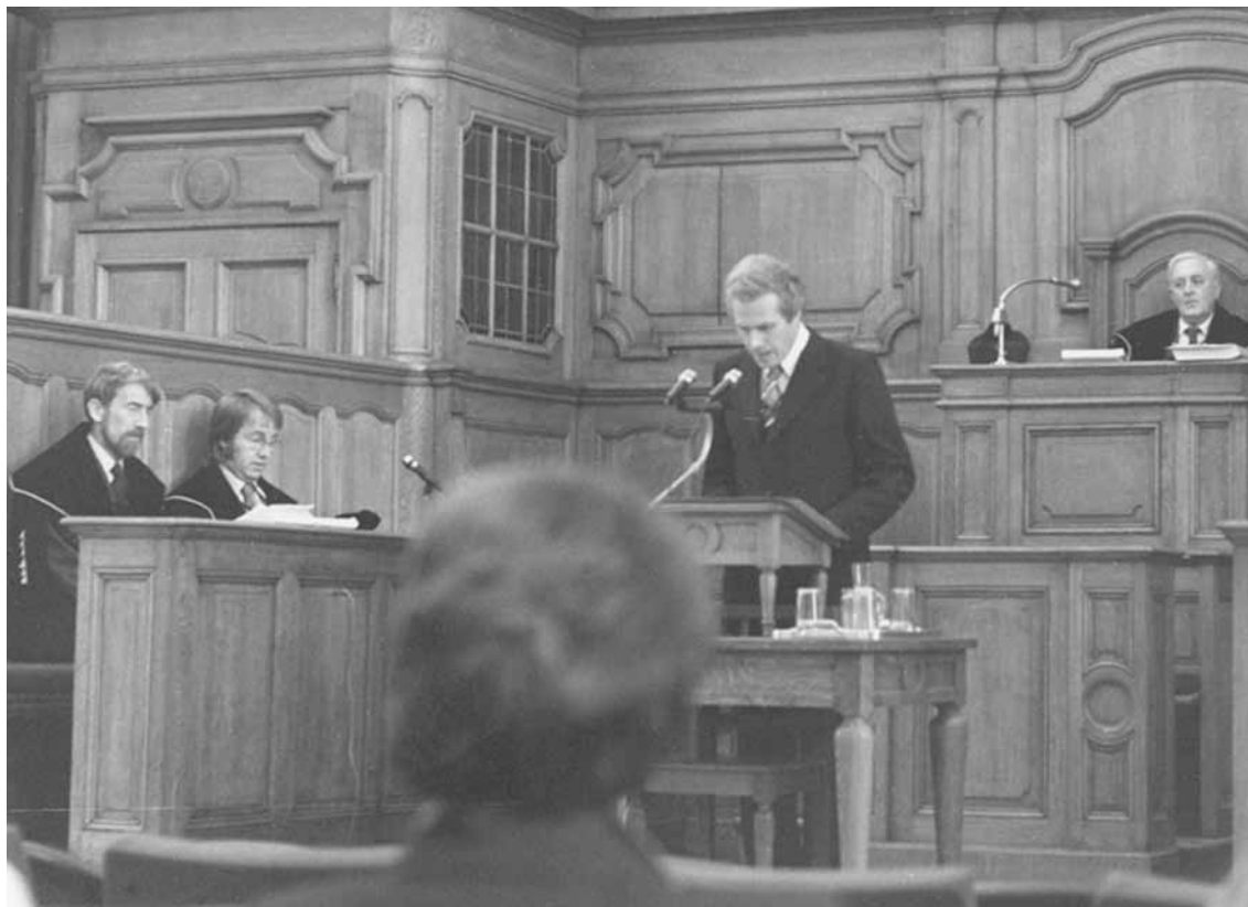
Defensa de tesis doctoral en Lovaina, 1978.