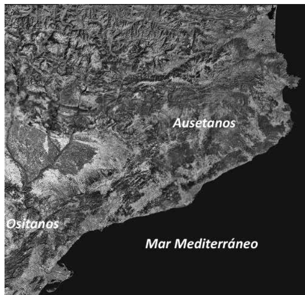
Figura 1. Situación de los Ausetanos y los Ositanos en el noreste peninsular.

Según Tito Livio, durante el 218 a.n.e., Cneo Cornelio Escipión sale de sus cuarteles, posiblemente en Emporion , y llega dispuesto a guerrear en el territorio ilergete (Tovar 1989 s.v. Ilergetes, Ilergetes, Ileraugati T-26.), abandonando Asdrúbal [Barca] el norte del Ebro. Sigue diciendo Livio que desde aquí el general romano se dirige al territorio de los Ausetanos, cerca del Ebro, aliados también de los cartagineses, poniendo cerco a su ciudad. En esos mismos momentos, realiza una embosca-