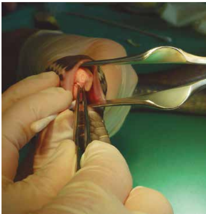
FIGURA 6. Huevo capturado con pinzas anatómicas para su extracción.

Durante el procedimiento fue realizado un hisopado de la mucosa de tracto reproductivo de la serpiente para cultivo y análisis microbiológico (Tabla 5). La prueba microbiológica efectuada en este caso para el aislamiento de Salmonella