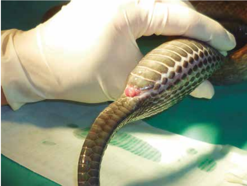
FIGURA 4. Masaje del huevo en dirección cráneo-caudal.