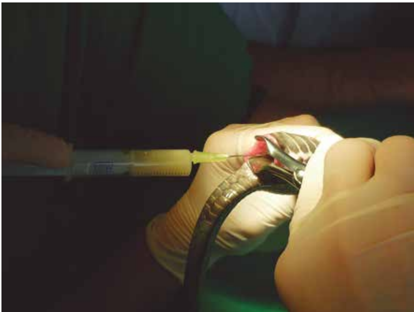
FIGURA 5. Punción del polo caudal del huevo para extraer su contenido.