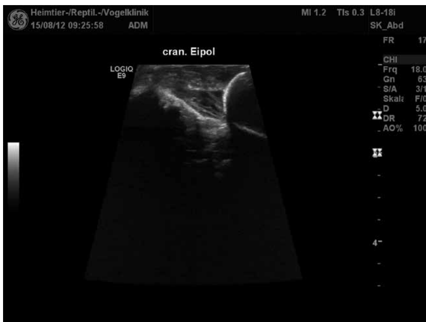
FIGURA 3. Vista ecográfica de polo craneal del huevo retenido.