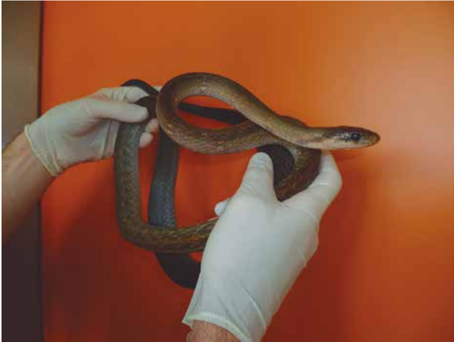
FIGURA 1. La serpiente ratonera amarilla Coelognathus flavolineatus de este caso.

Durante el examen clínico el animal se mostró letárgico y débil, presentaba una condición corporal adecuada y a la palpación de la cavidad celómica se evidenció un huevo posicionado cranealmente a la cloaca e inicios de prolapso cloacal. Posteriormente, se procedió a tomar una muestra de sangre de la vena