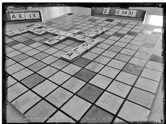
Figura 3: Scrabble artesanal

Se proponen distintos tipos de ejercicios. Algunos son más lúdicos ya que se trata de fabricar algo para jugar; el centro es el juego, el divertimento compartido. Por ejemplo, un scrabble