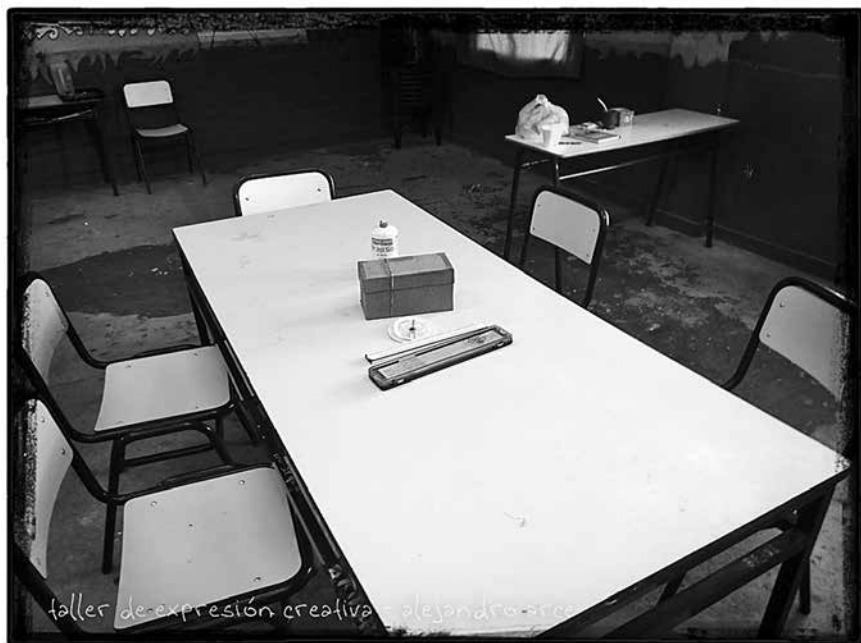
Figura 2: Concepto de proceso: el inicio, los instrumentos, el resultado.

programa y sobre la transmisión de los mismos contenidos, busqué otra forma de llegada. No bajé los objetivos sino que busqué la forma de poder (sistemáticamente) acercarme. La idea era llegar a ellos a pesar de todas estas dificultades [...] (entrevista a Alejandro Arece, 22 de febrero, 2014).