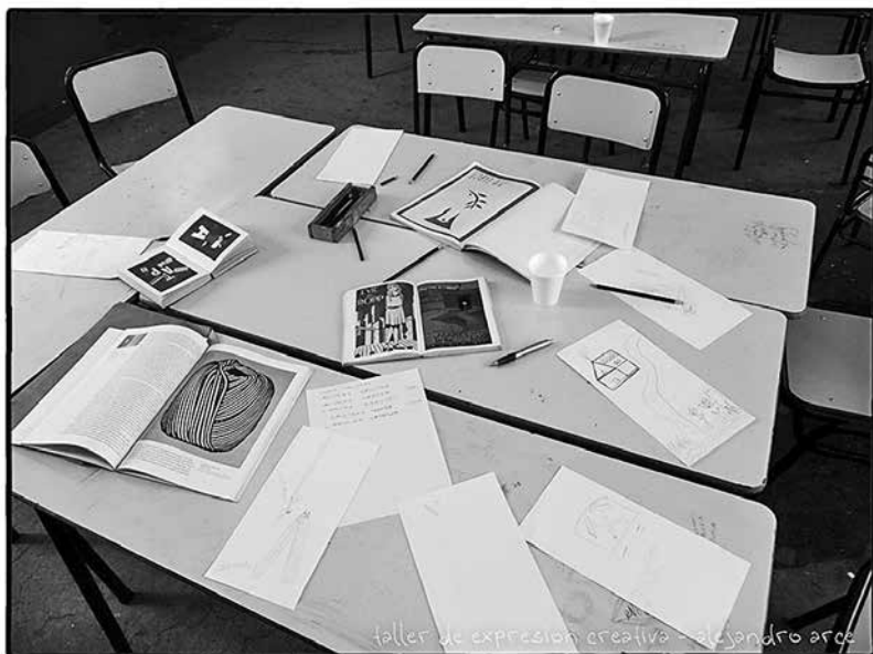
Figura 5: Uso de libros ilustrados.

El Taller de Expresión Creativa es una propuesta para provocar una experiencia en conjunto; se trata de hacer algo: un juego de palabras, la recreación de un estilo en la historia de las imágenes, la realización de un experimento, el mejoramiento y la decoración del aula, la pintura de un mural, la preparación de un video, entre otras posibilidades. Pero además se despliega una estética en los mismos materiales utilizados para motivar y desarrollar dicha tarea.