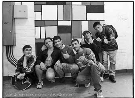
Figura 7: Integrantes del Taller.