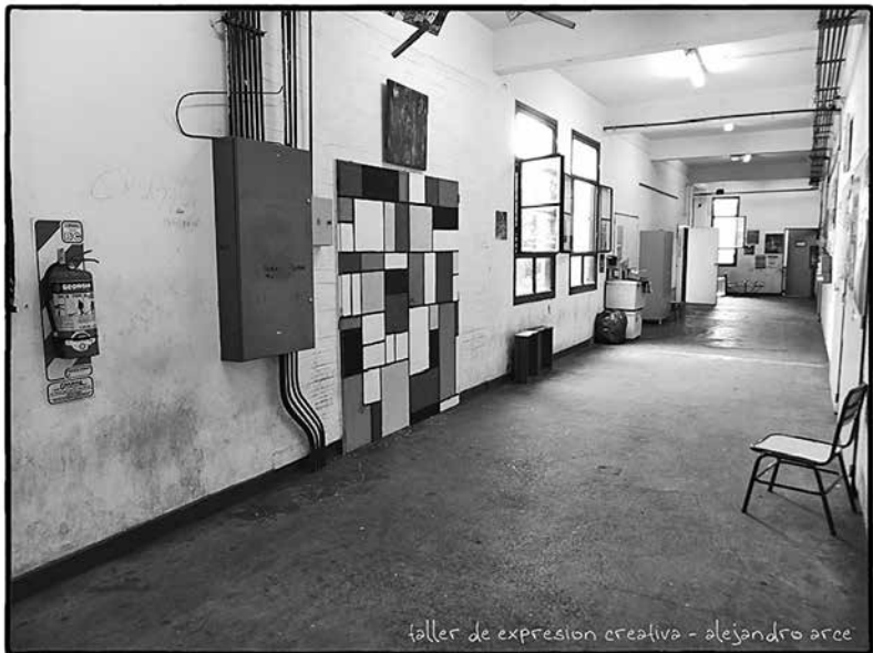
Figura 4: Mural realizado en equipo.

Otros ejercicios se orientan para la preparación de un utensilio. Por ejemplo, una regla de cálculo. Mientras un conjunto de actividades del taller es el de la preparación de productos artísticos o estéticos: se trata de dejarse llevar por la creación de un objeto estético (por ejemplo, un mural realizado en equipo) para que puedan sentir placer en el proceso y en la contemplación. Se intenta además de introducirlos en un acto curatorial: se les pide que vuelvan a ver. La evaluación de lo efectivamente hecho por ellos les permite proyectarse en un trabajo grupal futuro que involucra una lista de tareas a realizar.