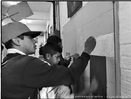
Figura 6: Experiencia colectiva

momento de la historia del arte, se narran historias que involucran a personajes motivados en ese momento histórico, que deseaban hacer algo. Se aprovecha ese repertorio icónico como instrumento para presentar el artista y su vida (biografía y anécdota). El nuevo conocimiento adquirido crea competencias (saben algo que no sabían), habilita nuevas situaciones (cuentan a otro lo aprendido), construyen roles en una mejor “distribución de las inteligencias” 11 (narran una anécdota del artista o de lo producido por el artista a otro maestro) tendientes a la “emancipación”.