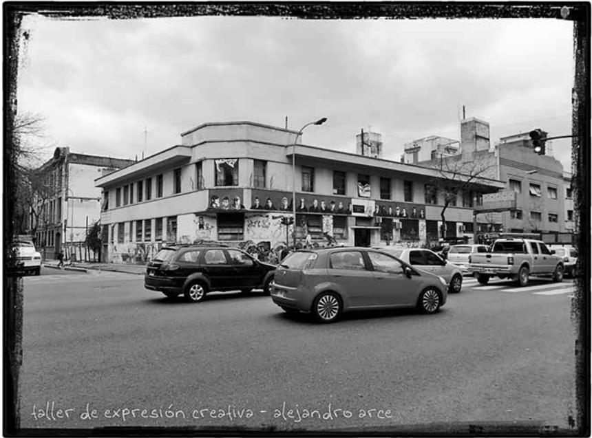
Figura 1: Seguimiento etnográfico de la escuela Isauro Arancibia

no previstos en todo espacio de enseñanza) sobre el que debe actuarse para enriquecer y democratizar la transmisión de saberes sobre la dimensión estética de los intercambios culturales.