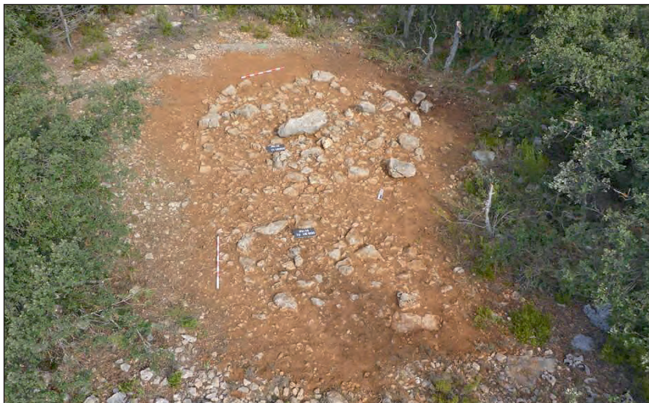
Figura 2. Agrupació tumular