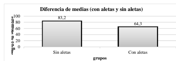
Figura 2. Diferencia de medias entre el test 1 (sin aletas) y el test 2 (con aletas)

La desviación típica de la muestra en la prueba sin aletas es 25,34 segundos y en la prueba con aletas es 9,57 segundos.