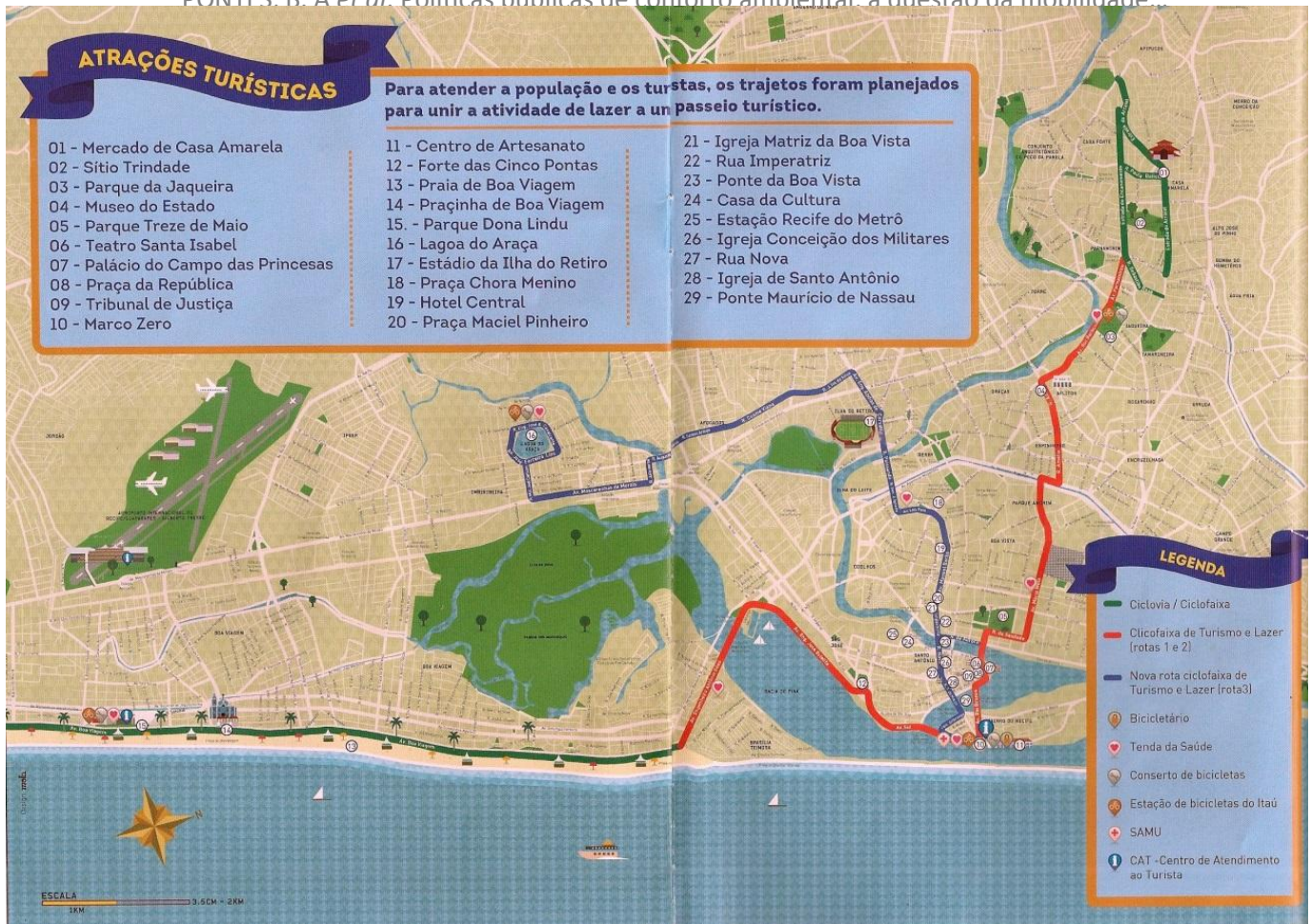
Figura 4. Mapa das ciclovias e ciclofaixas móveis na cidade do Recife