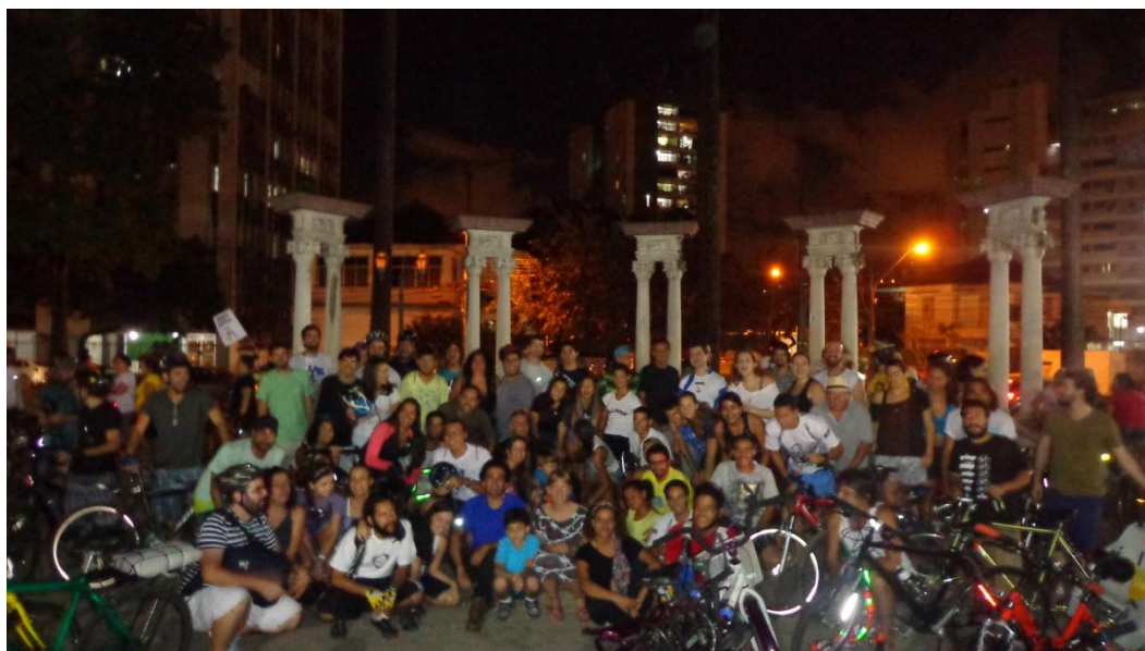
Figura 3. Concentração de grupos de ciclistas e cicloativistas no monumento Coreto, Praça do Derby, Recife.