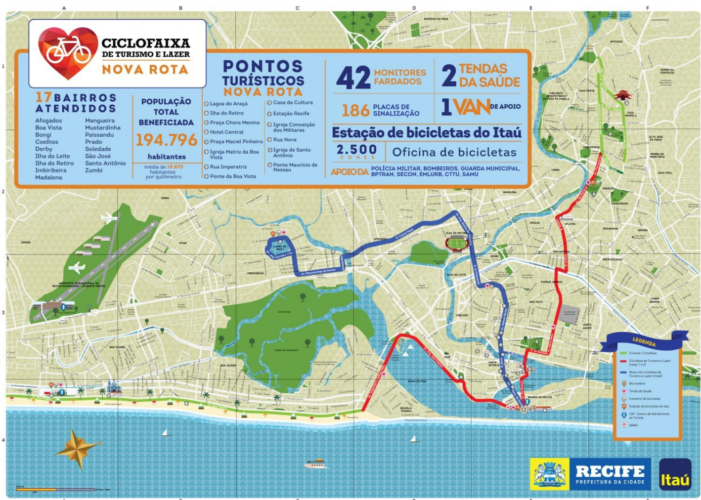
Figura 2. Mapa de divulgação da nova rota (Zona Oeste) da Ciclofaixa de Turismo e Lazer do Recife

Ao todo, as três rotas possuem quatro estações de aluguel de bicicleta (Jaqueira, Recife Antigo, Dona Lindu e Lagoa do Araçá) e quatro pontos de apoio e informação.