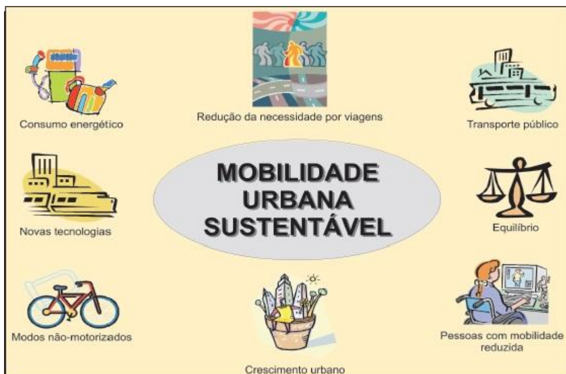
Figura 6. Alguns dos elementos que devem ser considerados na definição de mobilidade urbana sustentável.