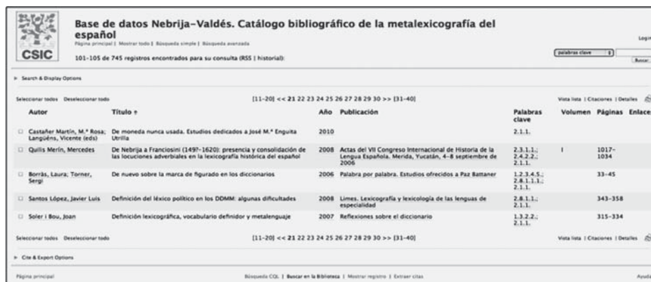
Figura 3. Interfaz de consulta de la Base de datos Nebrija-Valdés.