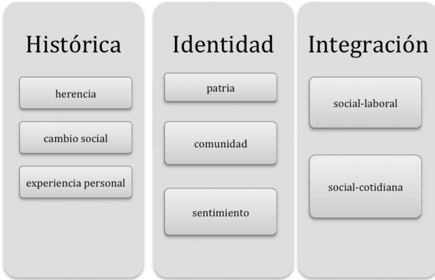
Fig. 3. Las “conciencias” de lengua e identidad en el sujeto emigrante.

1. Conciencia histórica : La percepción lingüística se basa no sólo en el conocimiento formal de la lengua, sino que se construye también a base de sentimientos, imágenes y percepciones retenidas, por ello cabe observar: