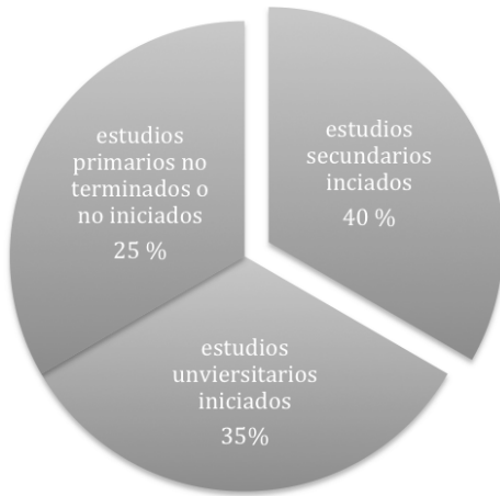
Fig. 1. Formación educativa de la muestra respecto al total de los encuestados.

La mayor parte de los entrevistados ha afirmado que sólo hace visitas ocasionales a su país, con una frecuencia no menor de dos años y medio. Un 70 % son solteros; el 90% tiene trabajo y lo desempeña en español. Todos tienen perspectivas de mejora laboral y les gustaría continuar sus estudios universitarios en España o complementar su titulación. La percepción general de los entrevistados es satisfactoria: les gusta hablar de su país, de su identidad y sentir que son tenidos en cuenta; igualmente, les agrada poder tener ocasión para expresar las dificultades de integración que han vivido, o incluso las posibles discriminaciones sufridas a lo largo de su periplo peninsular.