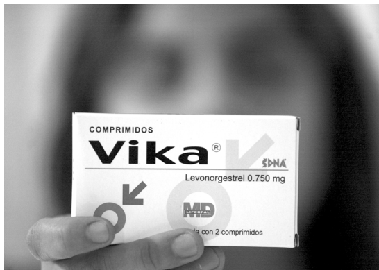
La píldora del día siguiente.

62 ◀ permite interrumpir un embarazo dentro de las primeras nueve semanas de gestación sin necesidad de hospitalización ni intervención quirúrgica. Es un método seguro de alta efectividad, y los estudios al respecto demuestran que 95% de los abortos inducidos por esta vía han sido exitosos. La RU 486 contiene mifepristona, una sustancia que provoca el aborto al bloquear la acción de la progesterona. Junto con una dosis de prostaglandinas, interrumpe el desarrollo de la placenta y estimula las contracciones uterinas. Como resultado, se produce la salida del tejido embrionario de manera similar a lo que ocurre en un aborto espontáneo. Es importante someterse a una revisión ginecológica posterior para garantizar que la expulsión se haya realizado completamente.