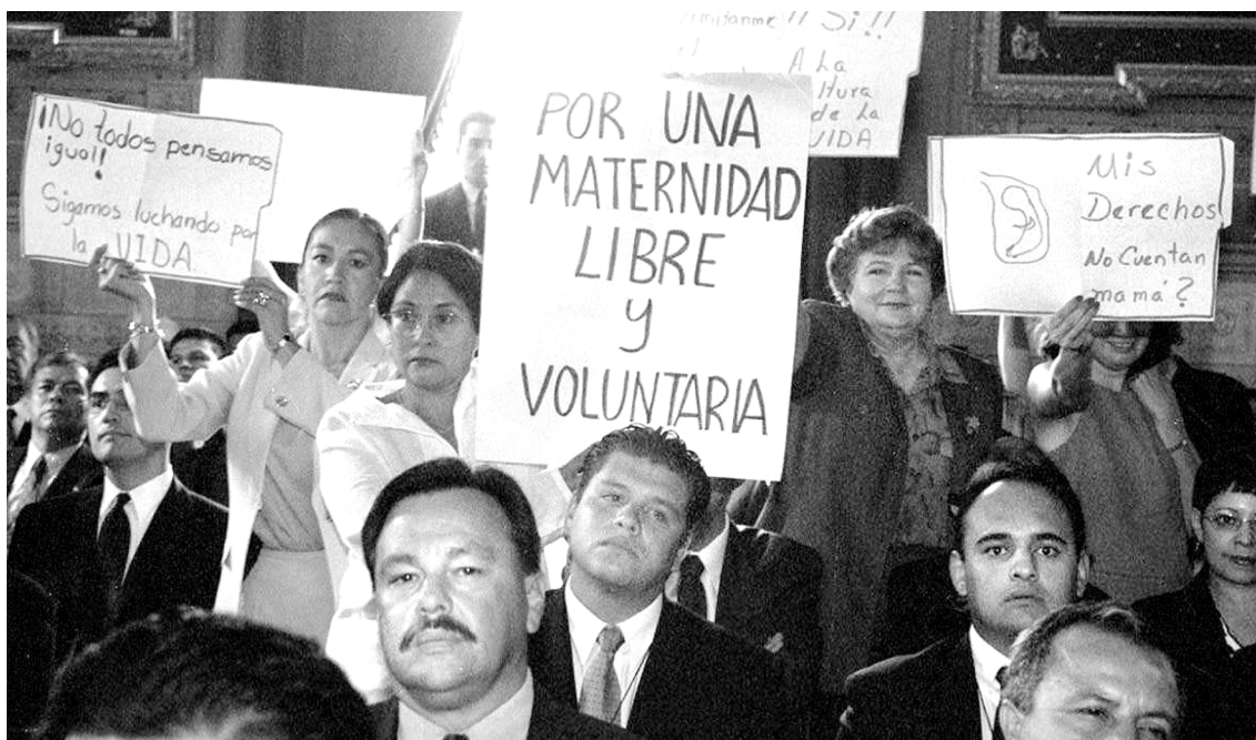
Durante el 5º informe del gobernador de Guanajuato Martín Huerta, panistas a favor de las recientes reformas al código penal del aborto por violación rodean a una mujer que protesta en contra, agosto de 2000.