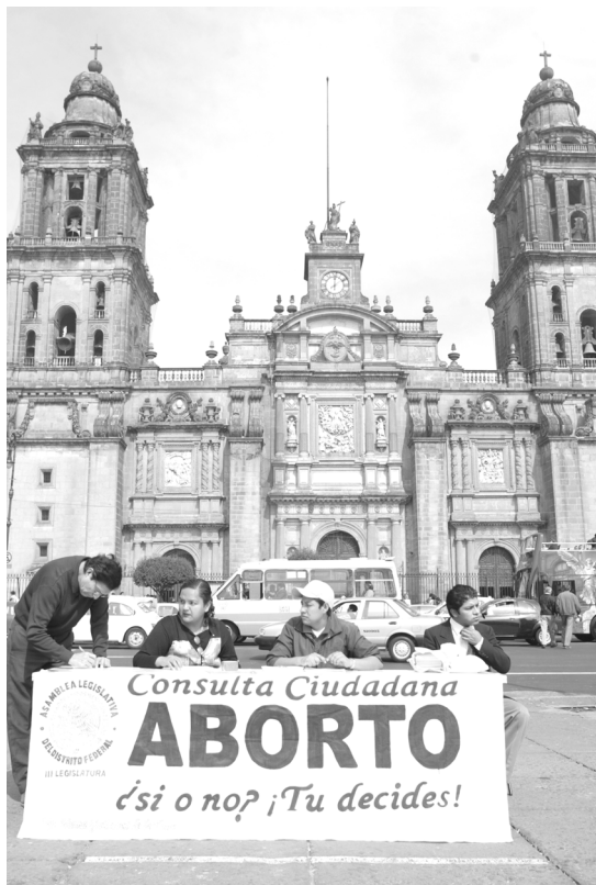
Consulta ciudadana en el Zócalo capitalino para despenalizar el aborto.

to médico oportuno, se mide en las muertes, casos de esterilidad y daños a la salud de miles de mexicanas. De ahí la importancia de una reforma legal.