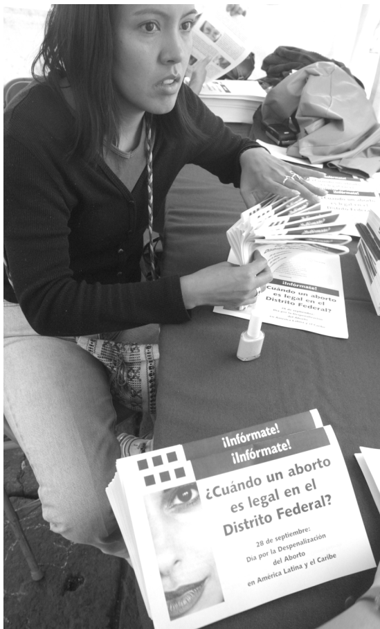
Mesas por la despenalización del aborto, ciudad de México.

no únicamente acerca de la procreación y su interrupción, sino por encima de todo, acerca de la libertad.