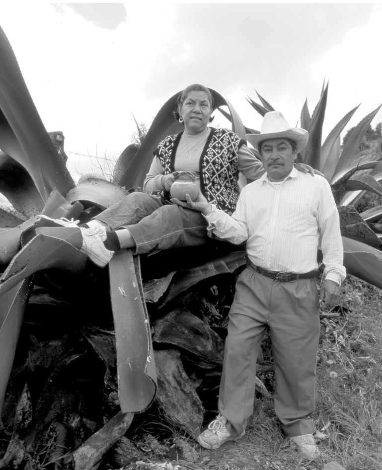
Los hermanos

un grado de sobriedad, de control sobre sus actos, de capacidad instrumental para el trabajo y de responsabilidad; responsabilidad no sólo para “dar la cara” sobre las consecuencias de sus acciones, sino también para “mantener”, que en la comunidad se entiende como un “saber dar la cara” por la familia, cualidades todas ellas que, por oposición, obligan a los varones adultos a alejarse de las