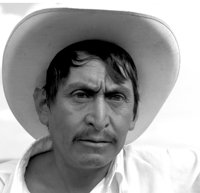
Vaquero / Foto: Lilian Stein.

Para lograr tales objetivos, se recurrió a recabar información cuantitativa y cualitativa. En primer lugar, se elaboró una base de datos sobre la mortalidad total ocurrida durante los años que van de 1930 a 1999, a partir de las actas de defunción del municipio. Con la ayuda del programa estadístico SPSS se procedió a realizar un análisis estadístico descriptivo que permitiera dar