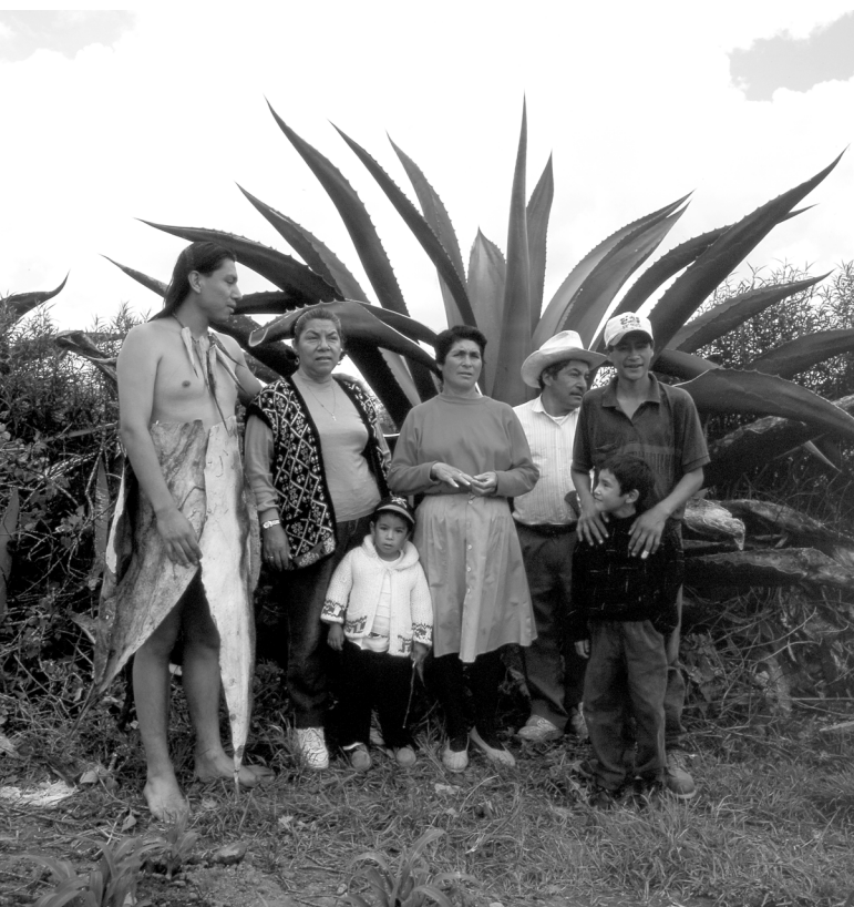
Familia y maguey

La lectura de estos datos a partir de la información cualitativa nos mostró que la poca representación de las muertes por conductas de riesgo de los hombres se debió a que en la región existe un modelo de socialización masculina que en la última fase de institución de la identidad de género (entre los 22 y los 25 años de edad), exige a los varones, para ser considerados “hombres de verdad”, la demostración pública de una serie de actitudes asociadas a la seriedad y a la responsabilidad, tales como la disciplina laboral, la capacidad para “mantenerse a sí mismos” o “mantener a la familia”, el control sobre sus actos, la sobriedad y el respeto a sus iguales, actitudes que obligan a alejarse de conductas consideradas irresponsables y propias de los “poco hombres”, tales como la fanfarronería, la pereza laboral, la incapacidad para ser el sostén de la familia y de sí mismos, el exceso en la ingesta de alcohol y la participación en riñas “sin razón”. Este mismo proceso de construcción de la identidad masculina explica la razón por la cual los varones que tienen entre 15 y 20 años de edad concentraron el mayor número de muertes por conductas imprudenciales a lo largo del periodo estudiado. En la medida en que a esa edad los jóvenes se encuentran en una fase de transición hacia la adquisición de la “hombría”, muestran una tendencia a involucrarse en una serie de rituales de masculinización que implican casi siempre un cierto grado