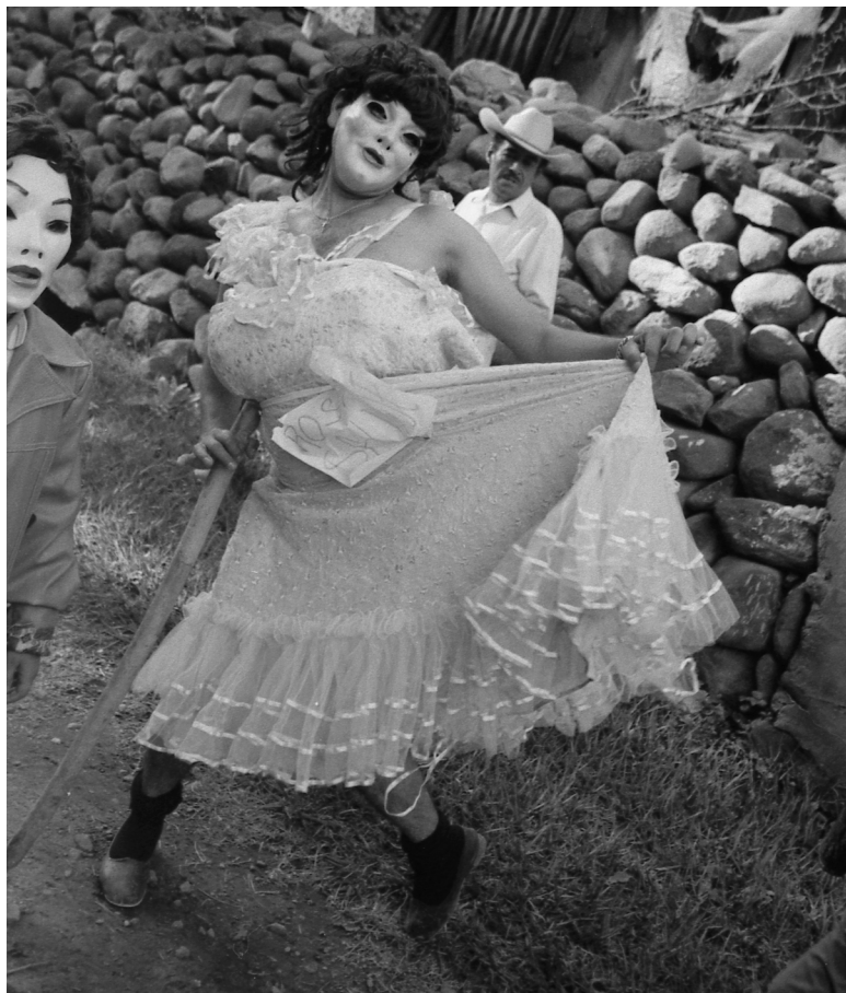
Travesti 1

Sin embargo, estos rituales que involucran la demostración de fuerza y cierto grado de osadía y arrojo forman parte de una fase transitoria dentro del prolongado proceso de construcción de las identidades masculinas. Entre los 20 y los 25 años de edad, etapa en la que unos ya