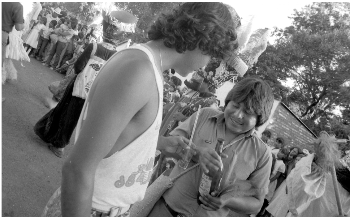
Mojiganga 2

Las muertes por accidentes no imprudenciales según grupos de edad mantuvieron un comportamiento diferente a lo largo del tiempo. Los más afectados fueron los menores de cinco años, casi todos ellos fallecidos por causa