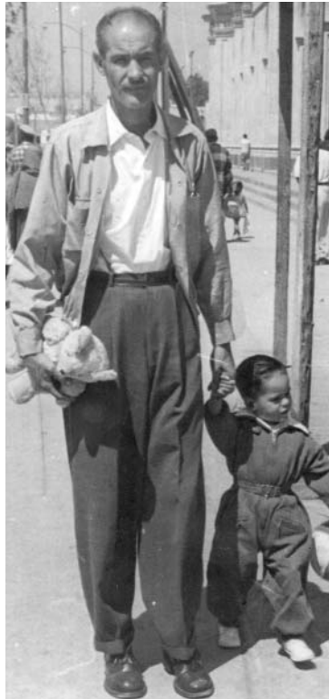
Década de 1950. Calendario Coriac 2000 / Cortesía de Coriac.

Pero otros lugares muestran una práctica más nítida de segregación socioespacial. Si bien el uso de las plazas públicas también es indistinto, no es así el de los centros comerciales, que depende más del estatus. Los analizados en este libro son más bien de clase media y alta, pero hay centros