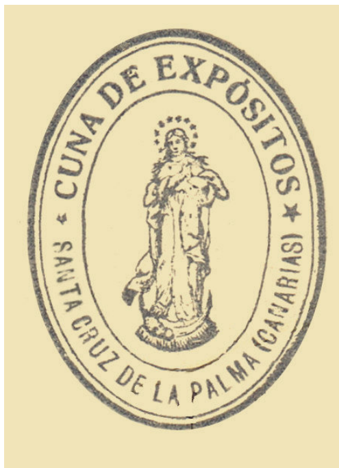
Sello de la Casa Cuna.