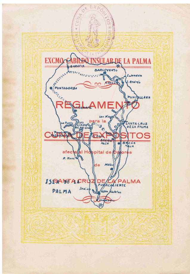
Cubierta del reglamento de la Casa Cuna.

De este Reglamento conservamos tres ejemplares y a continuación mostramos la cubierta de uno de ellos porque lleva estampado el sello propio de la Cuna de Expositos, con la imagen de la Inmaculada Concepción, y además mostramos el sello de la contracubierta, en el que aparecen fundidos el escudo de la isla y el escudo de España en aquel momento, una fusión que no habíamos encontrado en ningún otro documento de la época.