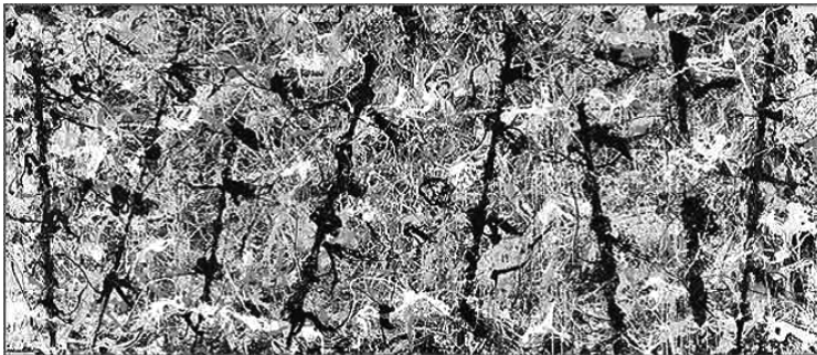
Figura 1 – Blue Poles: Number 11 (1952)

Jackson Pollock não recebeu um diagnóstico conclusivo, mas especula-se que sofria de psicose maníaco-depressiva. Alguns elementos, no entanto, talvez possam sustentar essa hipótese, especialmente quando se considera sua relação com o próprio corpo e a maneira como isso influenciou sua arte. Outra evidência seria a criatividade que aflora em suas catarses, provavelmente hipomaníacas ou maníacas, nas quais seu trabalho se manifesta como irrupção do inconsciente.