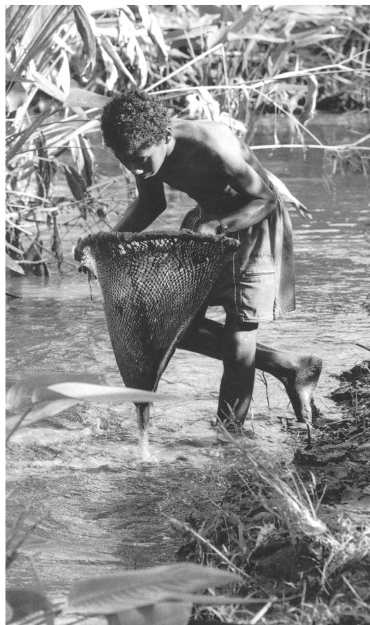
Corralero, afromixteca de la Costa , Vittorio D'Onofri, 1995

Los documentos, citados en su parte significativa, proceden todos del Archivo General de la Nación, donde están a la disposición del público lector; pero no son los únicos. En los libros de cabildos en los archivos de las catedrales de las diócesis principales hay materiales sobre bailes de negros que esperan clasificación e interpretación. El presente trabajo intenta mostrar los antecedentes africanos de la música, el baile y el canto populares en