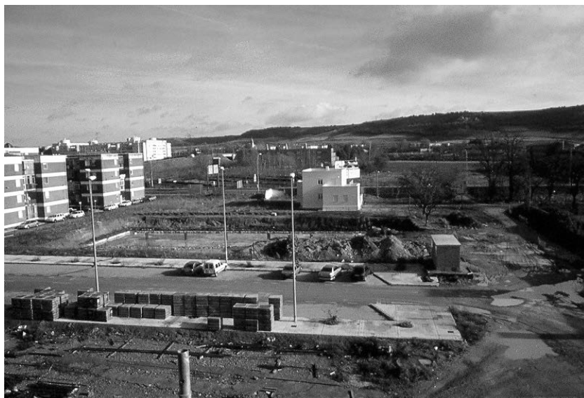
Foto 5.- Edificio E en cimientos y chalet Administración: E. Delgado, Enero de 2001.