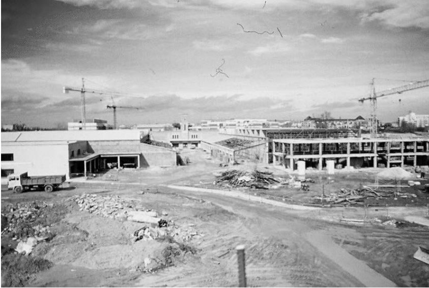
Foto 3.- Aulario y Enología en construcción. Marzo de 2001.