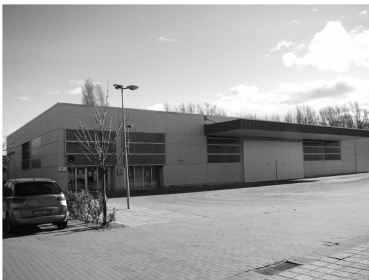
Foto 6.- Estación de ensayo de abonadoras y sembradoras.