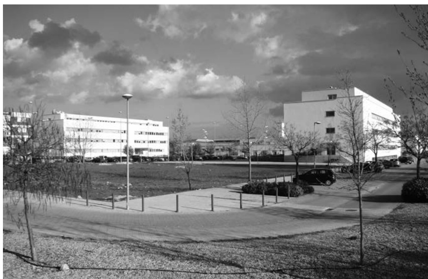
Foto 2.- Los edificios departamentales y parcela Bloque IV.