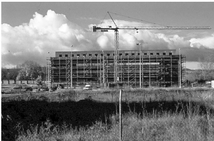
Foto 1.- El edificio D en construcción. Foto: E. Delgado, Octubre de 2000.