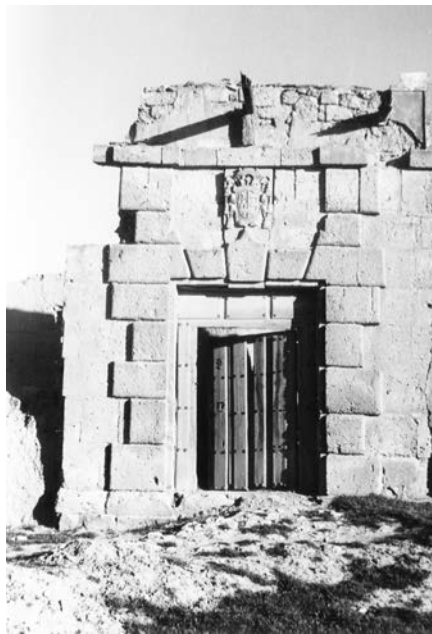
Capillas. Portada del pósito. Foto L.D.C. (h. 1965)

La capilla de san Antonio en la iglesia parroquial de san Agustín ha llegado a nosotros en muy buen estado y conservando muchas de los objetos con los que se dotó en el momento de su fundación. La nueva documentación que se analiza nos permite