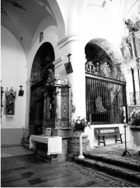
Capillas. Interior de la iglesia de San Agustín