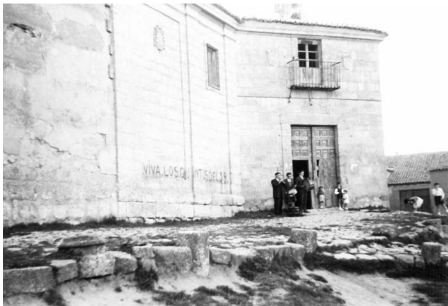
Capillas. Exterior de la capilla fundada por don Francisco Blanco de Salcedo junto al Hospital de Todos los Santos. (h. 1965)