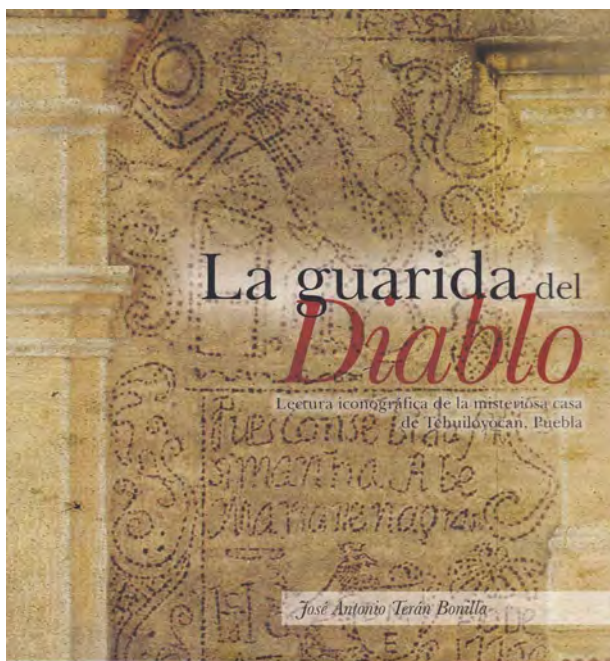
Fig. 2. Portada del libro del Dr. D. José Antonio Terán Bonilla, La guarida del diablo , publicado en Puebla (México) en el año 2013.

EMM: Me ha llamado especialmente la atención su libro La guarida del diablo 25 . ¿Cómo se gestó una investigación tan singular?