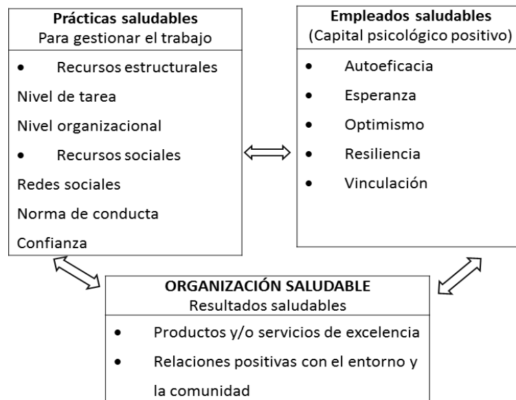
Figura 3. Modelo heurístico de organización saludable (Salanova, s.f., p. 32.).

Hay un aspecto importante (Salanova, s.f.) el cual indica que el estado de vinculación psicológica con el trabajo se ajusta a los resultados que se obtienen con el desempeño, el bienestar y la calidad de vida en general, como si se tratara de un estado positivo que hace posible y facilita el uso de recursos. Desde la perspectiva organizacional, la vinculación con el trabajo se relaciona positivamente con el desempeño y la fidelidad del cliente, el desempeño académico en estudiantes universitarios y el compromiso organizacional, el desempeño en equipos y negativamente con el absentismo, rotación y tendencia al abandono (p.10).