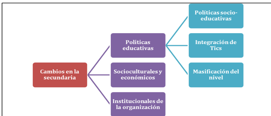
Figura 1. Categorías pregunta abierta: Transformaciones del nivel secundario

Las preguntas abiertas se categorizaron a posteriori , a través de la lectura minuciosa de las respuestas y la realización de sucesivos agrupamientos con la ayuda del Atlas.ti, hasta que se obtuvieron los códigos definitivos (ver figuras 1 y 3). Se consideró la frecuencia en las preguntas de opción múltiple y la cantidad de menciones de las categorías definidas en las abiertas, en este caso se analizó la jerarquía, es decir, los códigos con mayores o menores menciones, cantidad de referencias (citas) en las respuestas vertidas por los profesores.