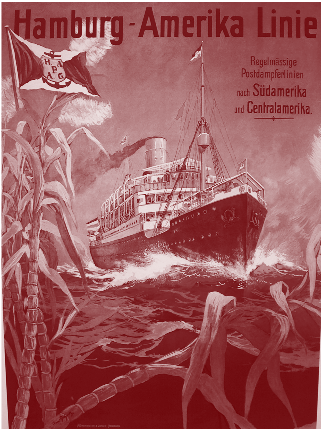
▪ Hamburg-Amerika Linie, 1903 | Hans Bohrt