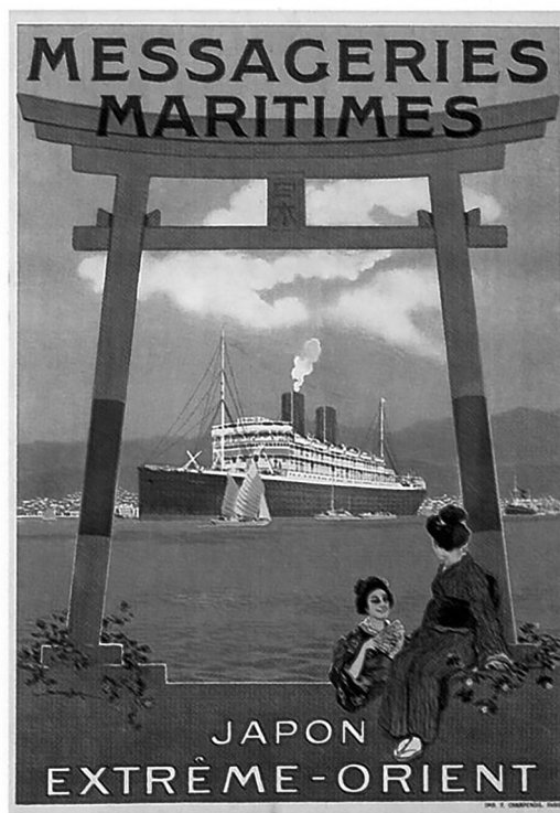
▪ Messageries Maritimes , 1920

En su retórica mesiánica, el multiculturalismo neoliberal ha mostrado esta vieja exigencia de autodeterminación y reconocimiento de la pluralidad como suya; una dádiva en la expansión de su lógica de derechos; la usurpación, por lo demás, es burda. Pero al mismo tiempo, dicha conquista ha desatado la furia de las máquinas de guerra, que no están dispuestas a dialogar horizontalmente con la alteridad. Estamos ante una imposibilidad histórica, que busca resolverse con la institucionalidad paliativa de la ayuda y la emergencia