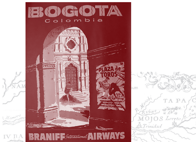
■ Braniff International Airways, c. 1950's

lítico-ideológica. Es decir que se trata de un conflicto originado, ante todo y principalmente en una alegada exclusión política [...]. En Colombia las regiones con mayor presencia de grupos ilegales y con mayores tasas de homicidio se caracterizan por tener: 1) grandes rentas en conflicto: oro,