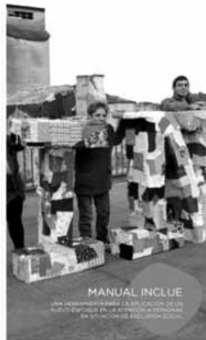
Publicación Manual INclúe

Ademais de todo iso, o feito de que estes resultados se alcancen nun marco de colaboración interinstitucional, cun alto grao de participación e compromiso por parte das entidades socias e colaboradoras, no que as persoas directamente afectadas por situacións de exclusión social participan activamente e en espazos compartidos con responsables e persoal técnico das organizacións, supón, en si mesmo, un dos factores que maior satisfacción xera nesta iniciativa.