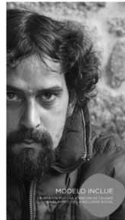
Publicación: Modelo INclúe