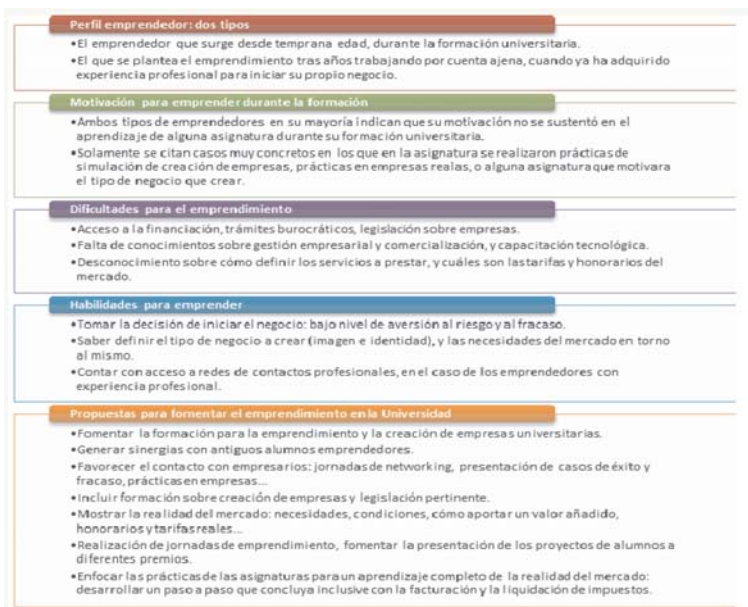
Figura 1. Análisis de las entrevistas a emprendedores.

En las siguientes figuras se resumen los resultados de las entrevistas realizadas a emprendedores, que fueron alumnos de alguna de las asignaturas de la Red interuniversitaria creada para la investigación.