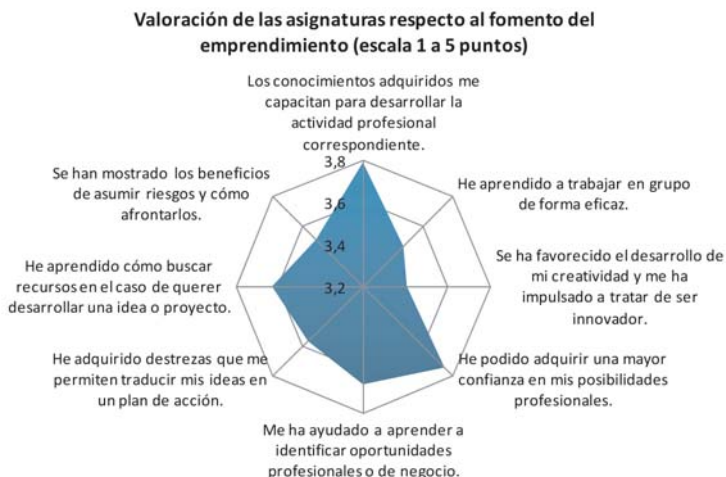
Figura 4. Valoración media general del fomento del emprendimiento.

Por otra parte, la valoración global media de diversos criterios sobre el emprendimiento en las asignaturas participantes en la Red Interuniversitaria (en una escala 1 a 5 puntos) es superior a los 3,4 puntos en todos los ítems, como se aprecia en la siguiente figura. Esto es, al menos, una puntuación de aprobado alto de la formación para el emprendimiento de la Red. No obstante, no encontramos puntuaciones globales superiores a 4 puntos, lo que indicaría la necesidad de incluir elementos de mejora que permitieran perfilar la enseñanza para el emprendimiento.