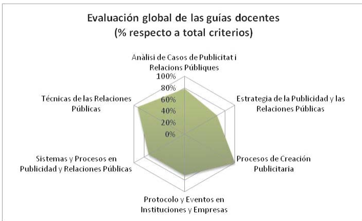
Figura 2. Evaluación global de las guías docentes por asignatura.

Atendiendo a puntuaciones ponderadas, y de acuerdo a los criterios descritos en el marco teórico, se evaluaron las guías docentes de las asignaturas objeto de estudio. Los resultados globales son los que mostramos en la siguiente figura, y posteriormente pasamos a detallar.