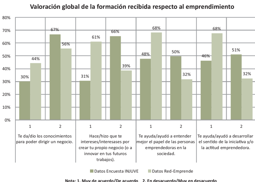
Figura 3. Valoración general del fomento del emprendimiento en la formación. Comparación con datos INJUVE (2012:14).

En primer lugar, podemos señalar que encontramos un amplio acuerdo entre los alumnos consultados respecto al beneficio de la formación recibida hasta el momento en diversos aspectos relacionados con el emprendimiento, como se muestra en la siguiente figura 11 . Asimismo, cabe destacar que muestran un considerablemente mayor nivel de acuerdo con los aspectos analizados sobre emprendimiento en la formación, que los del conjunto de jóvenes españoles del estudio sobre emprendimiento del INJUVE (2012) con el que los se ha comparado. No obstante, es posible que dicha diferencia pueda radicar en el hecho de que estamos contrastando un público universitario frente a un público general de jóvenes con diverso nivel de formación.