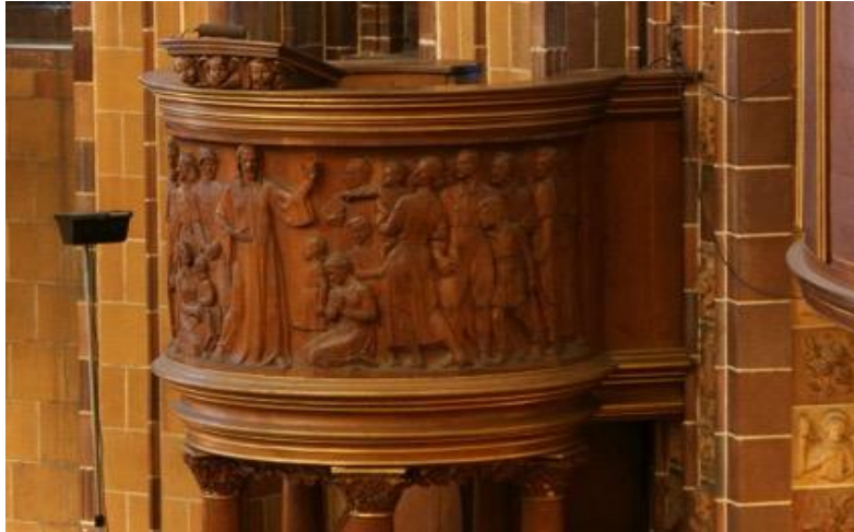
Imagem 1a: Púlpito. Martin-Luther-Gedächtniskirche (Igreja Memorial Martin Lutero), Berlim, Alemanha, 1935.

Fonte: Site oficial da Igreja: http://www.mlgk.de