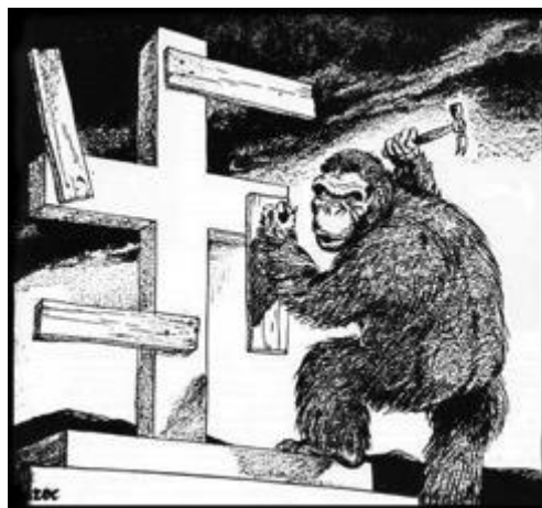
Imagem 6. The New Christianity. 100% Aryan.

O texto em alemão diz: “Sobre a fundação da Igreja do Estado [Alemão]. A cruz ainda não era forte o bastante”.