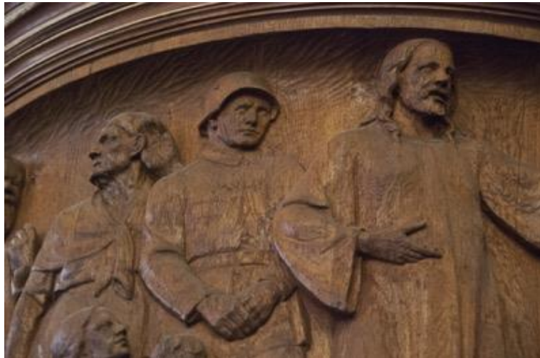
Imagem 1c. Pormenor do Púlpito. Martin-Luther-Gedächtniskirche (Igreja Memorial Martin Lutero), Berlim, Alemanha, 1935.