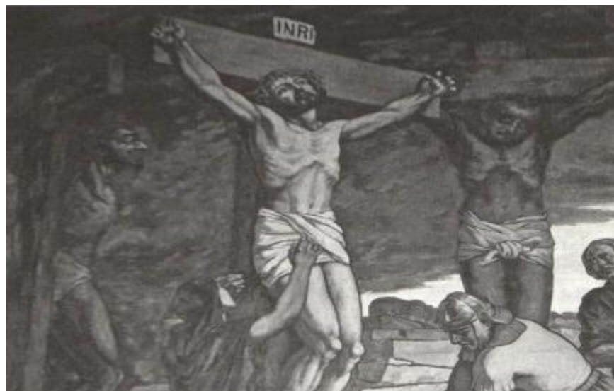
Imagem 7b. Detalhe do afresco, com ênfase no rosto de Jesus racialmente branco e no rosto de um dos crucificados à esquerda, com seu nariz adunco ou aquilino