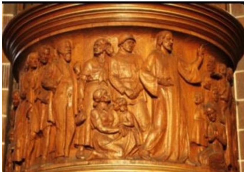
Imagem 1b: Detalhe do Púlpito. Martin-Luther-Gedächtniskirche (Igreja Memorial Martin Lutero), Berlim, Alemanha, 1935.