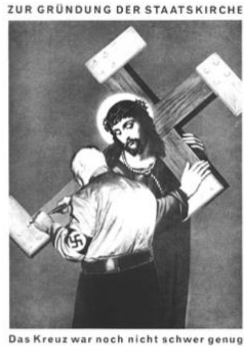
Imagem 5: Zur Gründung der Staatskirche. Das Kreuz war noch nicht scher genug