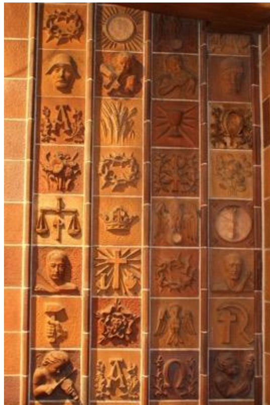
Imagem 2. Detalhe da Parede. Martin-Luther-Gedächtniskirche (Igreja Memorial Martin Lutero), Berlim, Alemanha, 1935.