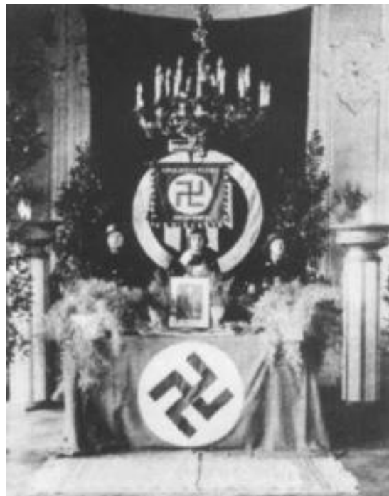
Imagem 4. Guenter Lewy. The Catholic Church and Nazi Germany.

Fonte: Heschel, 2008, p. 4 (mais a capa).