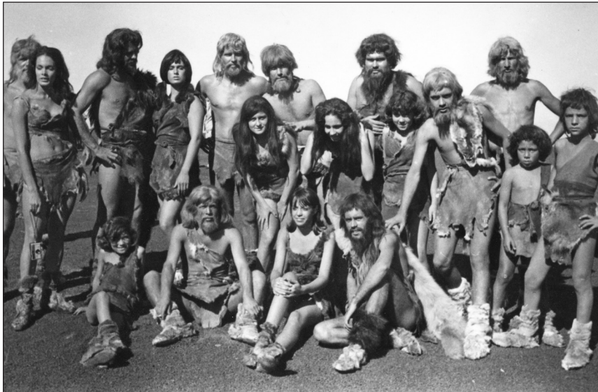
Actores y extras durante el rodaje de Hace un millón de años en Timanfaya en 1966.