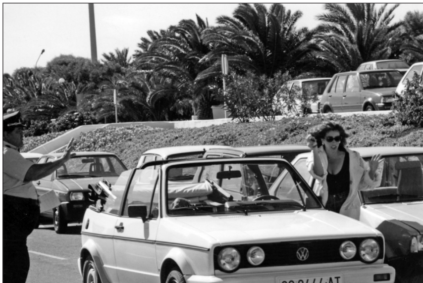
Fotografía del rodaje de Cómo ser mujer y no morir en el intento .