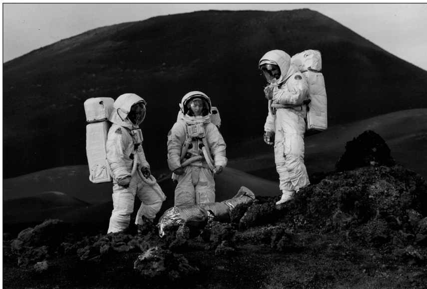
Rodaje en Timanfaya de Stranded. Imagen cedida por La voz de Lanzarote.