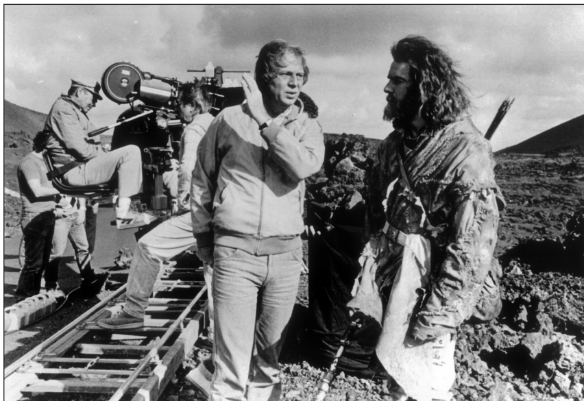
Fotografía del rodaje de Enemigo mío con Wolfgang Petersen y Dennis Quaid.