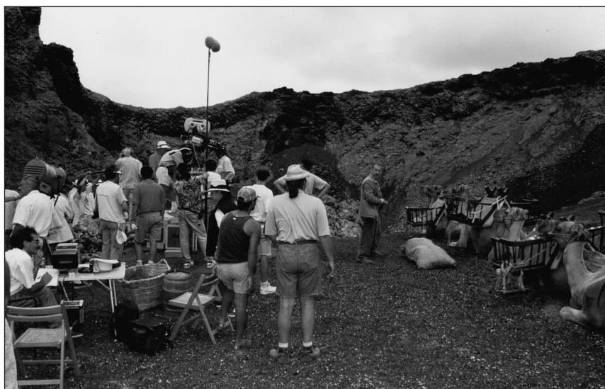
Imagen de la filmación de Mararía.