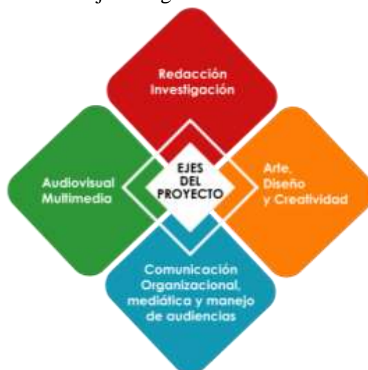
Gráfica 1.- Ejes integrados en el PIS de la UIDE