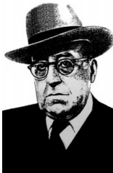
Ramón Otero Pedrayo (1888 - 1976)

A literatura galega falou así, e seguirá a falar, con linguaxe de seu sintonizada coa linguaxe das letras de fóra. Revelouno, de primeiras, a nosa lírica medieval. Na idade media, cando florecía en Galicia unha poesía de fondo raizame popular, produciuse aquí unha clara penetración influenciadora da poesía occitánica. Sabido é que o influxo cultural de Francia condicionou enerxicamente a nosa poesía trovadoresca. Ese