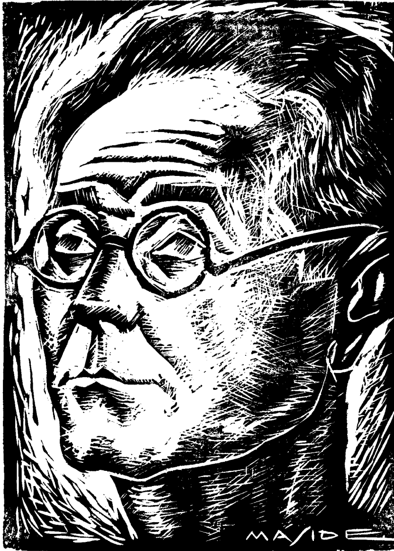
Retrato de Castelao. Gravado de Carlos Maside . "La ilustración en la Revista «NÓS»"

mantendo viva esa raizame, fonda, nutridora de novos e valiosos froitos. Dos degaros e afáns dos homes que nos marcaron un camiño, decorrendo os de Galicia con fiel andar, estamos a nos alimentar nós –quéirase ou non– en boa parte. Legáronnos ansia de coñecimento e superación, vocación de loita sabida previamente desigual; e os homes de hoxe, ao acadar ese herdo, vimos ser a mellor proba de nobreza dos seus empe-