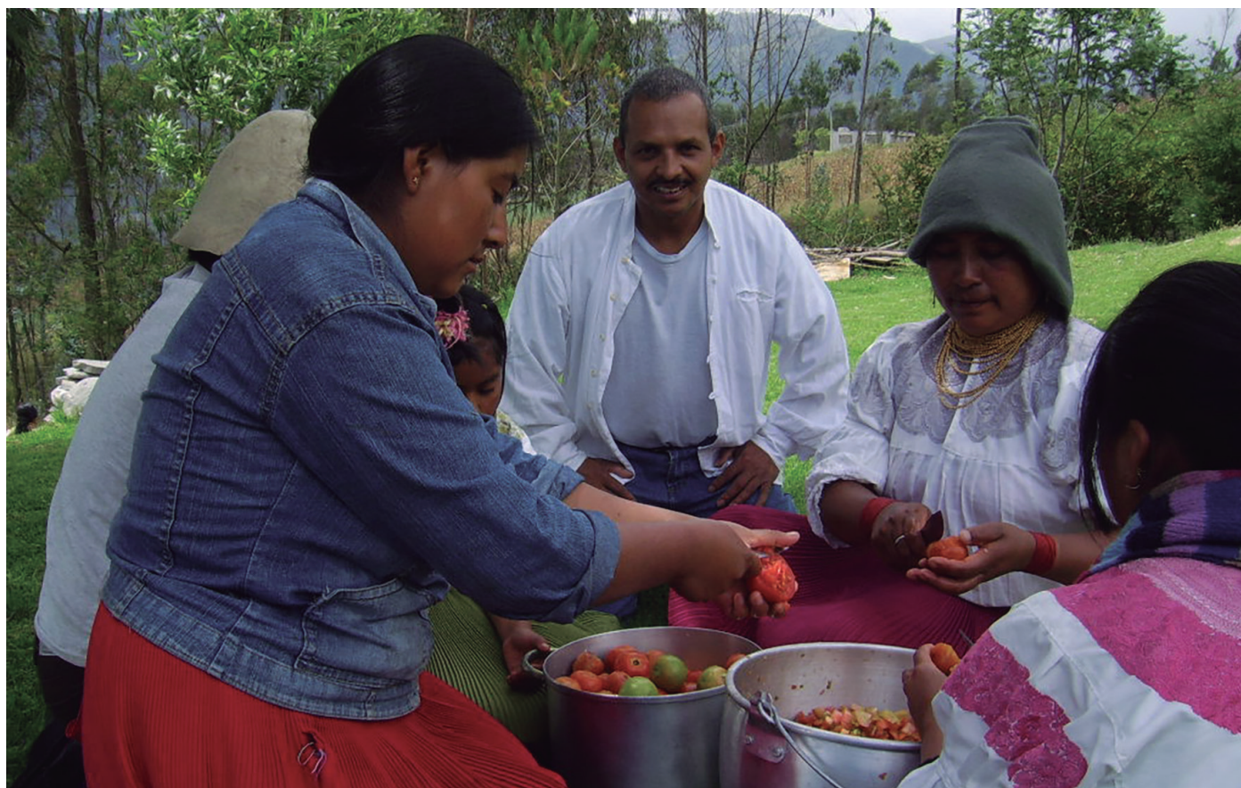
▲ Los saberes de la mano Comunidad Kichua de San Clemente, Ecuador, Foto: Samir Salgado, Año: 2009

La conversión y conmoción provocada por la conversación entendida por algunos como técnica de entrevista formal o artefacto técnico y por otros como forma de relacionamiento distante de los cánones y protocolos de la institucionalidad académica