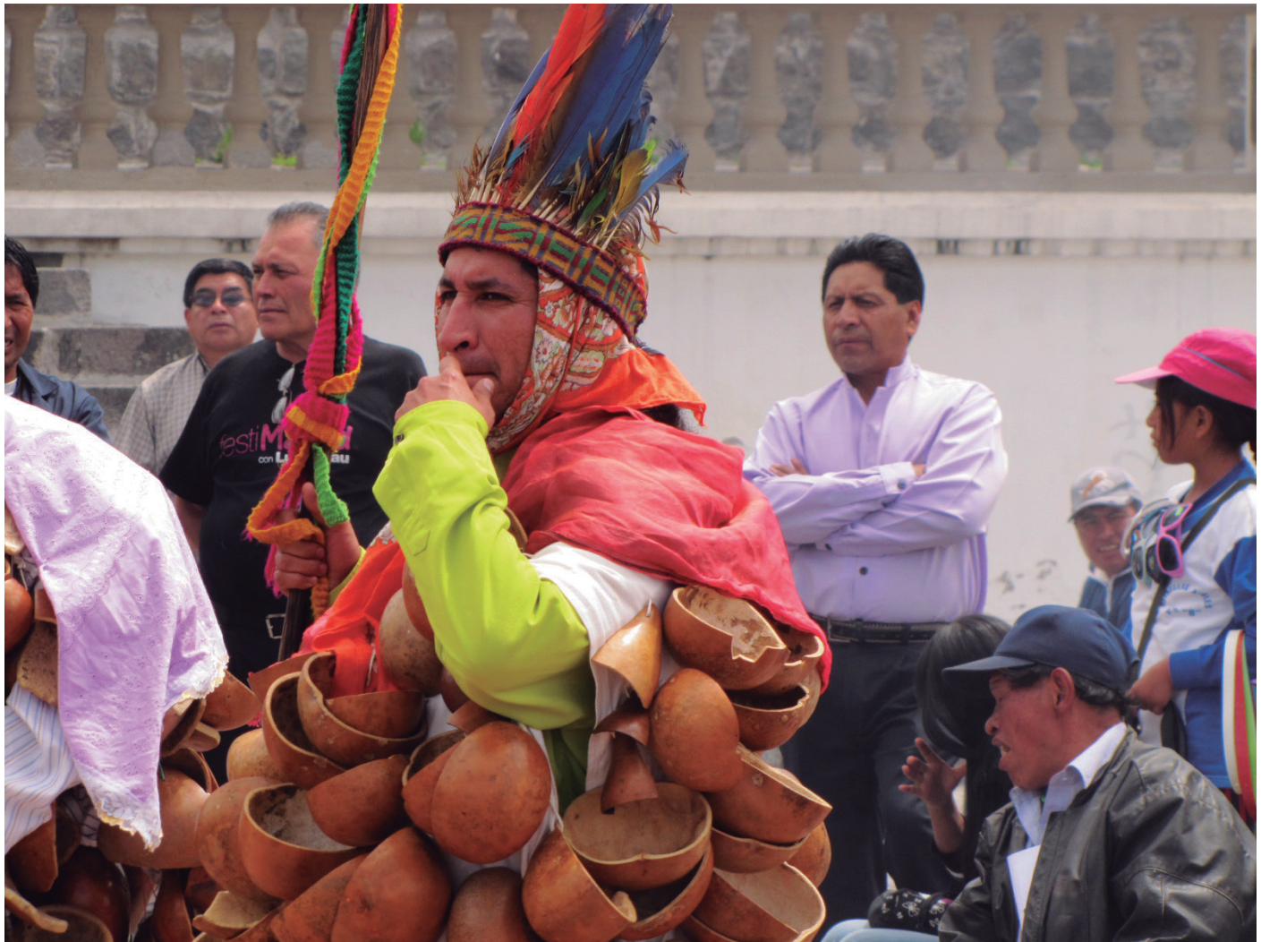
▲ La fiesta en el pueblo Karanki . Ecuador, Foto: Olver Quijano Valencia, Año: 2011

insulto a la inteligencia comunal y de comuneros. Son estas pequeñas muestras, expresiones acerca de la grandeza de los pequeños caficultores.