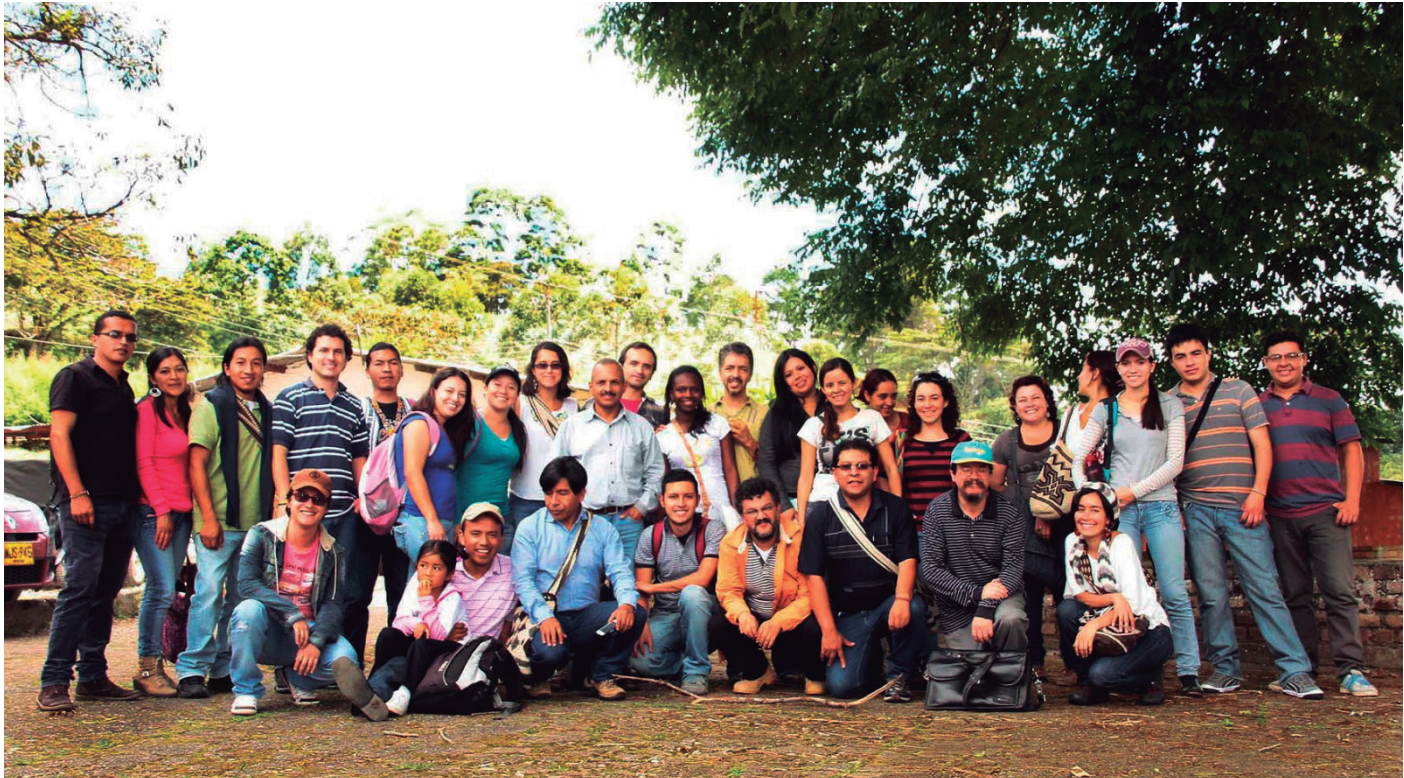
▲ Emprendizajes sobre el café. Cicaficultura, Cauca, Colombia, Foto: Alex Audivert. Año: 2015

Pensar en ‘caminar y con-versar’ como elementos y vías de aproximación al conocimiento en sus diversas formas y en distintos lugares, equivale a valorarlos como prácticas y gestos descolonizadores y como expresiones de ‘justicia cognitiva’, claro está, lejos de los cánones e imperativos disciplinarios, de las instituciones del aprendizaje (escuela, colegio, universidad) y de la metodología disciplinaria, esa que “nos propone una secuencia que deja de lado lo más importante, aquello que no puede ser anticipado en una prospectiva, lo verdaderamente nuevo, transformador. La metodología nos protege contra ello, nos impide conversar y dejarnos transformar por la conversación” (Haber, 2011, p. 25).