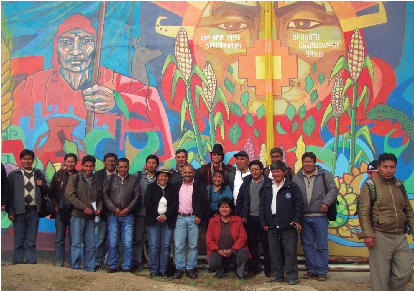
▲ Universidad para movilizar las sabidurías. Universidad indígena boliviana Aymara Tupak Katari , Bolivia, Foto: Olver Quijano Valencia, Año: 2015

escuchar en el otro cultural la verdad en tanto verdad, no simplemente en tanto relato, es algo que la disciplina no puede acometer. Tomarse en serio la diferencia es solo posible cuando el domicilio ha sido desplazado desde el lugar hegemónico de la disciplina hacia la diferencia, es decir, la diferencia desde espacio-tiempos otros (Grosso, 2011, p. 28).