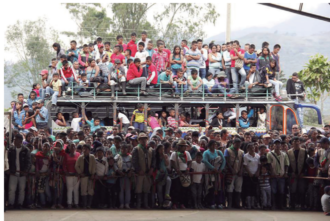
▲La chiva de la justicia indígena Nasa. Cauca, Colombia. Año: 2016

la práctica de la 'justicia cognitiva' según la cual, la salida está en los 'diálogos' interculturales y postimperiales en tanto "no podemos ampliar el horizonte de las posibilidades sin ampliar el horizonte de las inteligibilidades" (Santos, 2011, p. 18). Todo esto implica la necesidad de convivir con diversas formas de pensamiento sin el sometimiento exclusivo a la hegemonía epistemológica de la ciencia occidental y en el escenario universitario, muchas veces conservador, hermético y sin aperturas frente al desafío de pensar, construir y practicar el conocimiento de manera compleja, transcultural y transdisciplinaria.