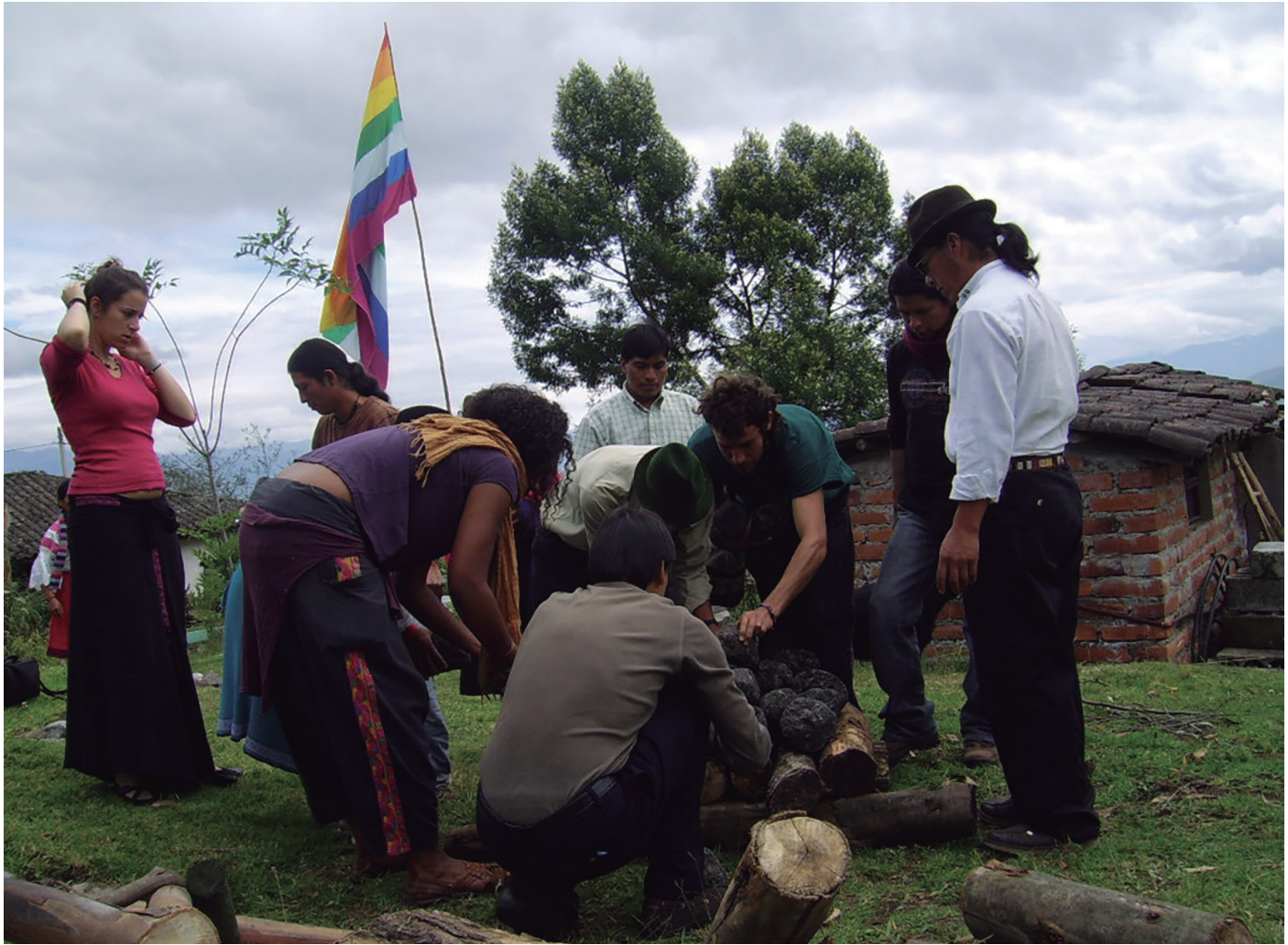
▲ Aprendiendo de prácticas comunales en la comunidad Kichua de San Clemente, Ecuador, Foto: Olver Quijano Valencia, Año: 2009

nuestros contactos con la institucionalidad escolar oficial y en medio de ella, nos hemos beneficiado con el saber de nuestros padres, herman@s y demás familiares, también con los conocimientos de vecin@s y de todos l@s amig@s de distintas edades, generaciones y condiciones con los cuales hemos aprendido y sigo aprendiendo a tramitar la vida en su dolor, pero también en sus fiestas y alegrías. En esta escuela vital que permanentemente construimos y reconstruimos con la gente, vamos aprendiendo el valor inmenso de la amistad, la cooperación, la fiesta, la conversación, el trabajo, la vecindad, la imaginación, la música, la rumba, la sonrisa aun en medio del dolor que nos agobia, y en general, la importancia de la solidaridad en la intensidad de la vida, pero asimismo en la muerte, momento en el cual también requerimos de la presencia y del afectivo y efectivo don del abrazo. Vivir los distintos lugares y el acto de tender redes desde la conversación, ha sido también la verificación de cómo no somos solo depositarios del sufrimiento sino también del valor de tener una sonrisa y un apretón de manos siempre disponible para reactivar las energías y esperanzas.