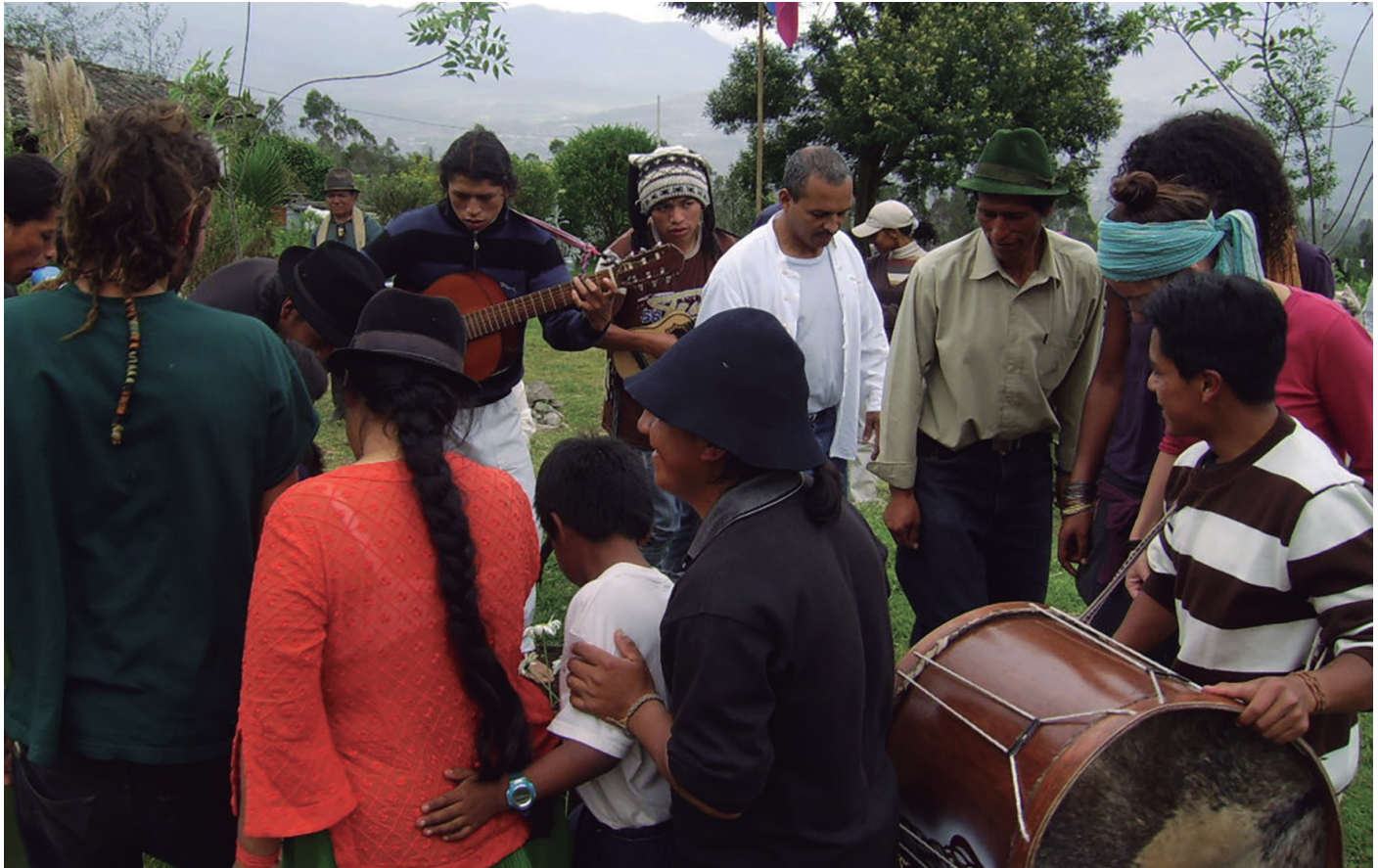
▲ Los legados de la fiesta del sol Comunidad Kichua de San Clemente, Ecuador, Foto: Olver Quijano Valencia, Año: 2009

materialidades desde donde se puede entender que no hay seres y ordenes culturales discretos y auto-contenidos sino en permanente enactuación, interrelación e interculturalización, muestra de que nuestras vidas, procesos y realidades son, radicalmente relacionales y, por tanto, es imprescindible considerar su valor y potencialidad en tanto condición de posibilidad y horizonte de esperanza e inteligibilidad.