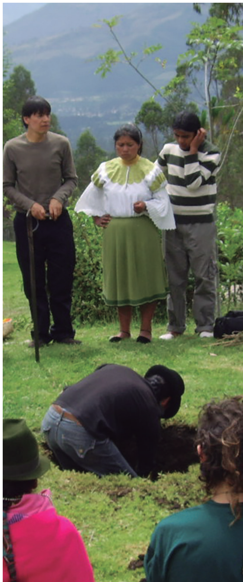
► Aprendiendo de prácticas comunales, Comunidad Kichua San Clemente (Ecuador), Foto: Olver Quijano Valencia, Año: 2009

Zibechi, R., y Hardt, M. (2013). Preservar y compartir. Bienes comunes y movimientos sociales . Buenos Aires, Mardulce.