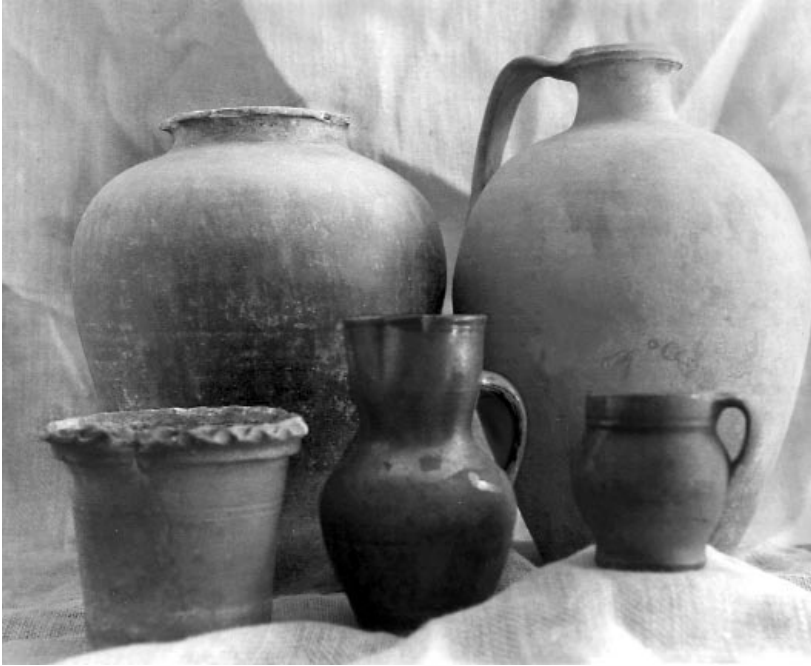
Grupo de «cacharros» de Rubiá: cántaro de pescozo volto e cantarilla de sulfato (detrás), e floreiro, xarro de viño e xarra de leite (diante).