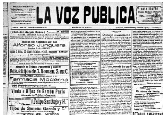
Portada e interior de “La Voz Pública”.