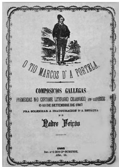
Portada de “O Tío Marcos da Portela”.

ata o amencer, no Buenos Aires que había pouco empezara a estrear século –“Allí se hablaba de mujeres, de arte, de política, de literatura y hasta de las carreras y de los amigos”–, debeu arribar a Ourense pouco antes de que o primeiro número da revista de