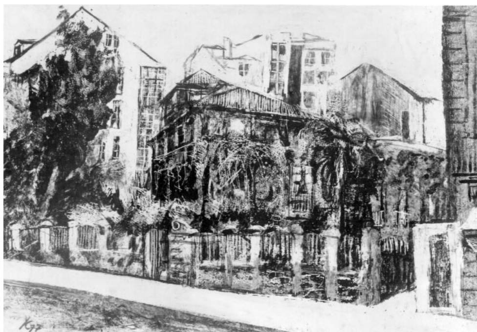
«Neste meu pervagar por Ourense, voume deixando ir cara os xardíns do Posío...»

dos que André Malraux dicía que eran "aventureros sen tumba, fascinados pola paixón do azar e reintegrados ó azar".