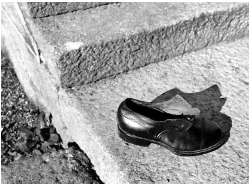
Zapato do Monchiño, un 55 “esparramado”.

Tamén se chegou a falar de unha oferta de 2 millóns de pesetas para percorrer Norteamérica durante un ano, mais os médicos desaconsellaran a viaxe.