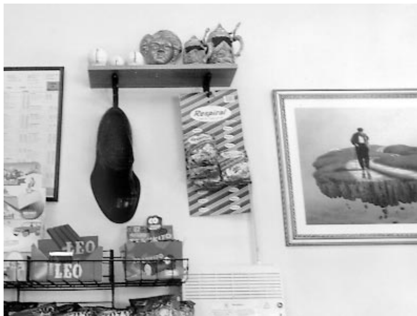
O zapato do Monchiño, exposto no bar "O Palleiro" de Lampaza.

Magarelos, lugar da parróquia de San Trocado no concello de Allariz, está encostado no monte o Outeiro do Piñeiro e situado á altura da verea que comunicaba Allariz e Celanova, transitada particularmente polos arrieiros e polos zapateiros de Allariz que se desprazaban á vila veciña para facer traballos de encarga. Por riba de Magarelos, a verea afundia-se entre leiras e toxearas, o que propiciaba as bromas dos rapaces que, aborrecidos mentres gardaban o gando, botaban terra e frouma sobre as cabezas dos viandantes provocando o natural enfado.