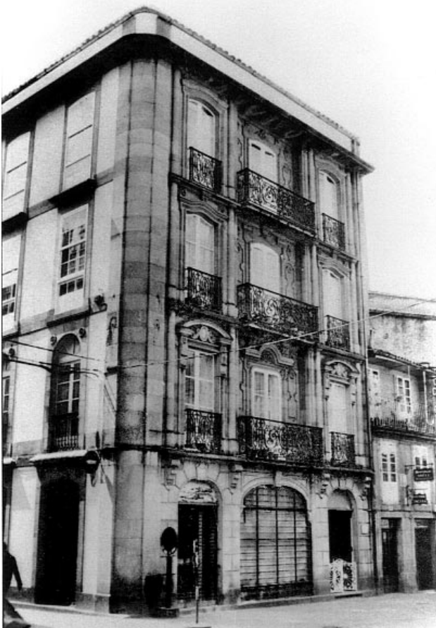
Hotel Suízo. Santiago de Compostela.