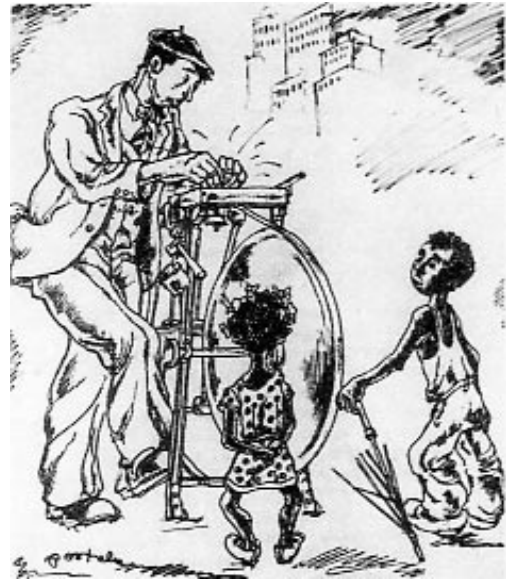
O Afiador. Debuxo de A. Portela (Pontevedra, 1906)

As primeiras rodas de afiar citadas polos informantes son as “Tarazanas” (rodas de afiar portatis). Constitúen antigos instrumentos de traballo dos afiadores galegos, que transportaban dun lugar a outro sobre os ombros. Aparecen asociadas a un egrexio colectivo de “afiadores lexendarios”, que seguen conservando o honor de telas recibido de profesionais do oficio foráneos. Constátase que unha destas “Tarazanas” portatis -a primeira da que se ten noticias certas-, entrou na provincia ourensana “para ser reparada no taller de Liñares”, e que nel “confeccionan unha maqueta dela” que logo empregarían os operarios para reproducila.