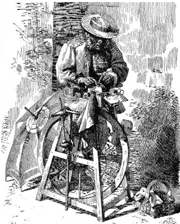
Afiador faenando na rúa. Gravado de F. de Guisasola (1880)

“Pódese dicir que a área de traballo é moi grande porque en cuestión duns meses movíame dun lado a outro de España. Podemos dicir que é moi pequena porque acostumaba a traballar nos portos, e un porto é unha zona moi pequena”.