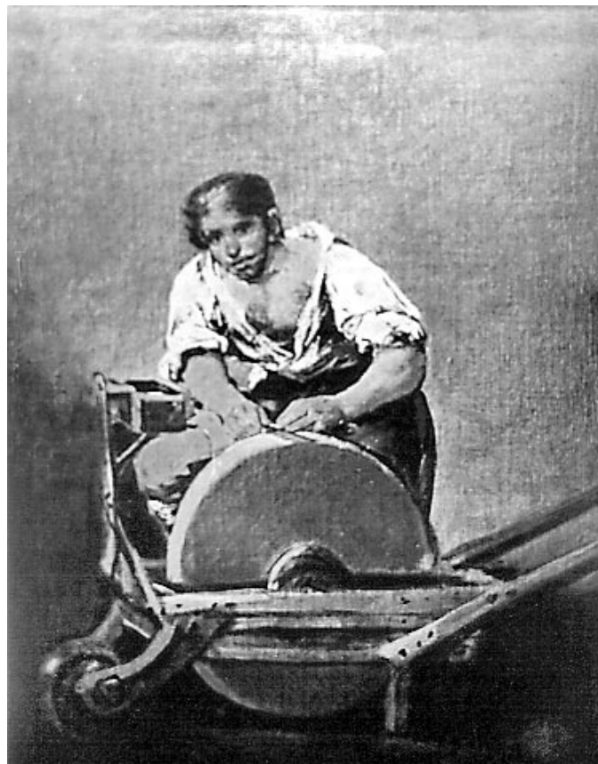
F. de Goya: “O Afiador” (1808-1812). Museo de Budapest.

c) Por último están as áreas de acción de reducida extensión , propias do conxunto de afiadores que optan por traballar soamente os núcleos urbanos e os seus arredores, ou nalgún barrio dunha grande cidade a onde chegaron un día e botaron raíces. Para estes afiadores que un día decidiron facerse sedentarios e trasladar alí a súa familia, o que antes era a súa área de acción convértese desde agora en área de clientela que lle trae a recompoñer os utensilios domésticos. No seu taller permanentemente instalado en calquera barrio de capital de provincia, o afiador repara os utensilios de corte ao