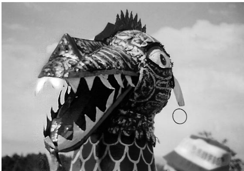
A ferocidade deste dragón procesional queda patente na cabeza da coca de Monção.

No Libro de acordos do concello ribadaviense, na acta correspondente á sesión do sete de abril de 1859, consta que se celebra desde su institución la función del Corpus Cristi , do que se deduce que se consideraba unha festa moi antiga, da que a organización e os gastos corrían por parte do municipio. Poido empezar contra o ano 1482, porque foi nesta data cando se declarou día santo para todo o bispado de Tui, rexendo a diócese Diego de Muros, e tendo en conta que nesta época Ribadavia era a segunda poboación en importancia logo despois de Tui, é de supoñer que, ó menos, se festexase dende esa data. Pero con isto non queremos afirmar de xeito categórico que non