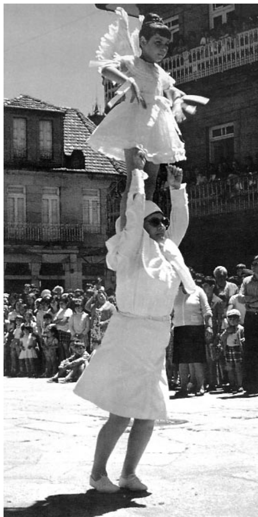
Unha das penlas de Redondela.

El día del Corpus sale el feno acompañado de él, y Alcalde de los vecinos, su Essno. de numº. y ministro, lo sacan a la plaza mayor con el gremio de las orneras, y el feno se queda en el atrio de la Iglesia, y el Alcalde con sus dependts. [dependientes] se vienen a dha. plaza, y de ella sale con los Gigantes un músico, Essno. y ministro, y van a la Oliveira, allí recuenta los Gremios, y sale con la procesión acompañado en todo esto con un Regidor; y llegando a [la iglesia de] S. Juan, da cuatro hachas para alumbrar al Smo. Nombre de Jesús 16 y busca quien la lleve y se endereza con la procesión a dha. Iglesia de Santº. Recuentan los Gremios en la puerta de la Villa de avajo y de recontados se junta con la Villa [corporación]. Sale la