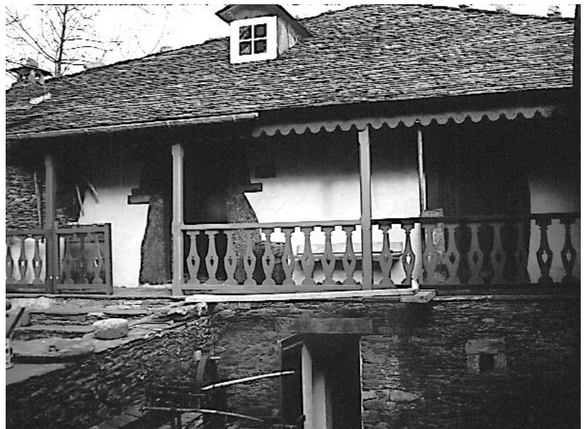
Corredor de entrada á casa.