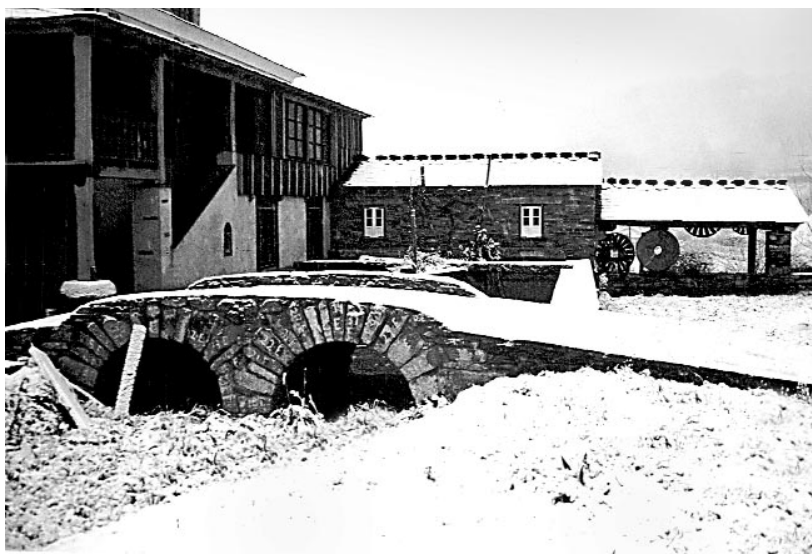
Exteriores da casa do muiñeiro, muiño e alpendre do muiño.

Un dos trece museos do Principado de Asturias –segundo a guía oficial de 1997– está en Grandas de Salime, capital do concello do mesmo nome que linda coa Fonsagrada, da que dista menos de trinta quilómetros de estreita e revirada estrada. Seguindo a teoría da botella medio chea ou media baleira, o Museo grandalés pode ser galego ou asturiano. Eu, desde logo, atópome entre os que opinan o primeiro; e a toponimia opina o mesmo: os letrados do camiño, xa no Principado anuncian Penafonte, Nogueirón, Xestoselo, Cereixeira, A Farrapa... estamos nun dominio do galego oriental, e se a lingua é o soporte básico dunha cultura, os usos e costumes que imos ver recollidos no Museo Etnográfico de Grandas son os que poderíamos ver noutros moitos lugares de Galicia, coa lóxica peculiaridade local.