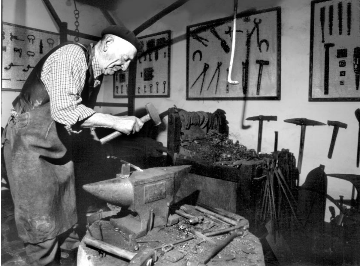
Ferreiro na forxa do propio Museo.