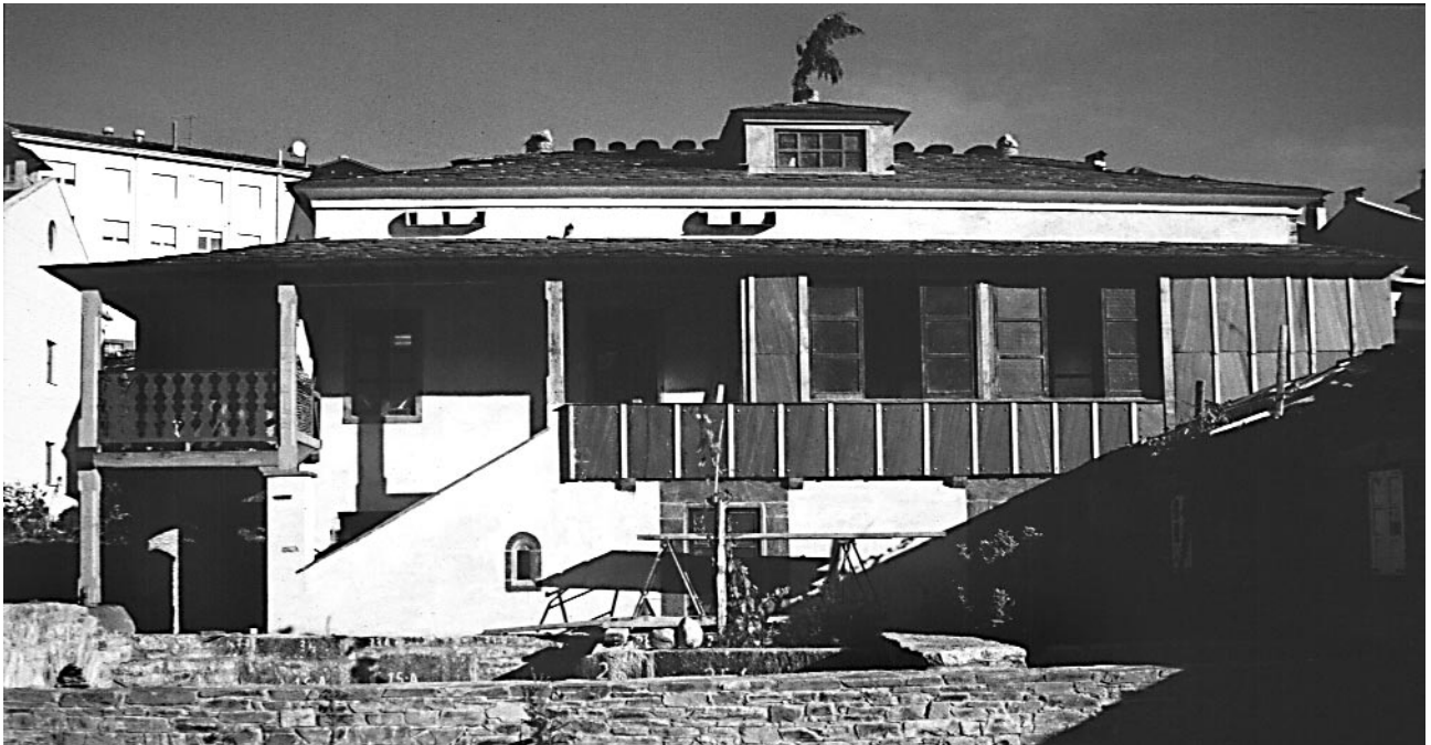
Casa do muiñeiro. Taller de restauración, arquivo, biblioteca.