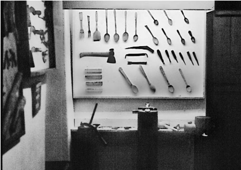
Ferramentas de cullereiro e culleres.