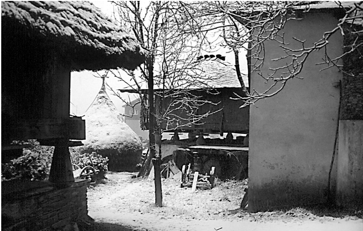
Vista parcial do horreo e paneira xunto ó palleiro.