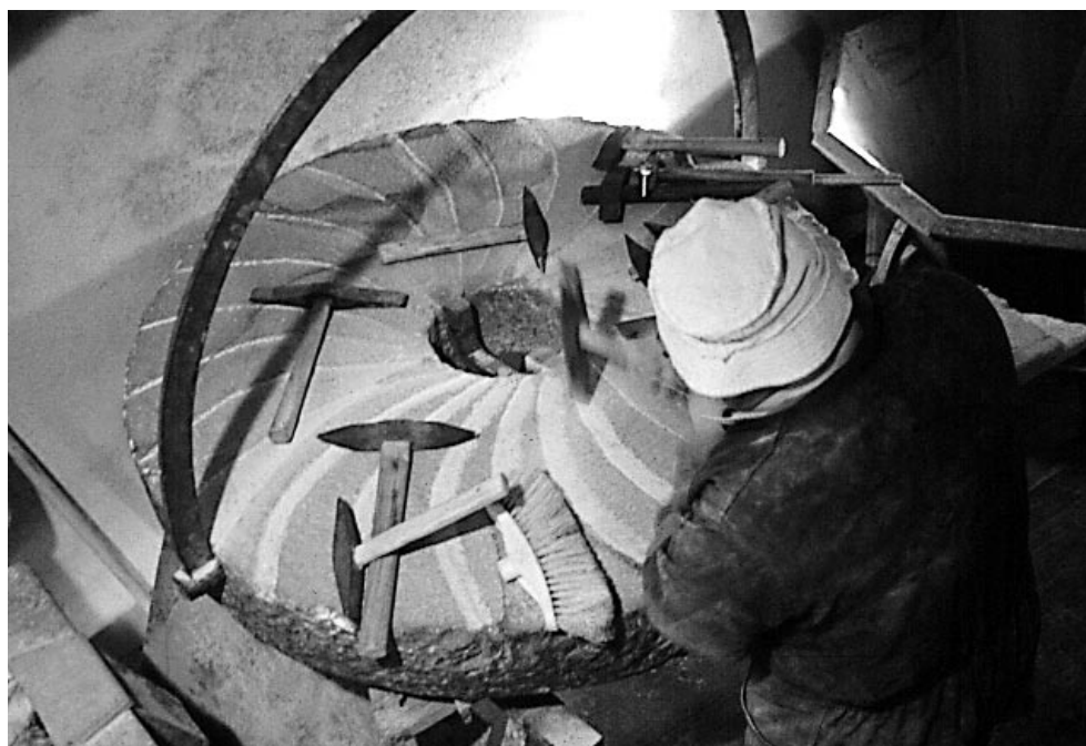
Muiñeiro picando a moa.