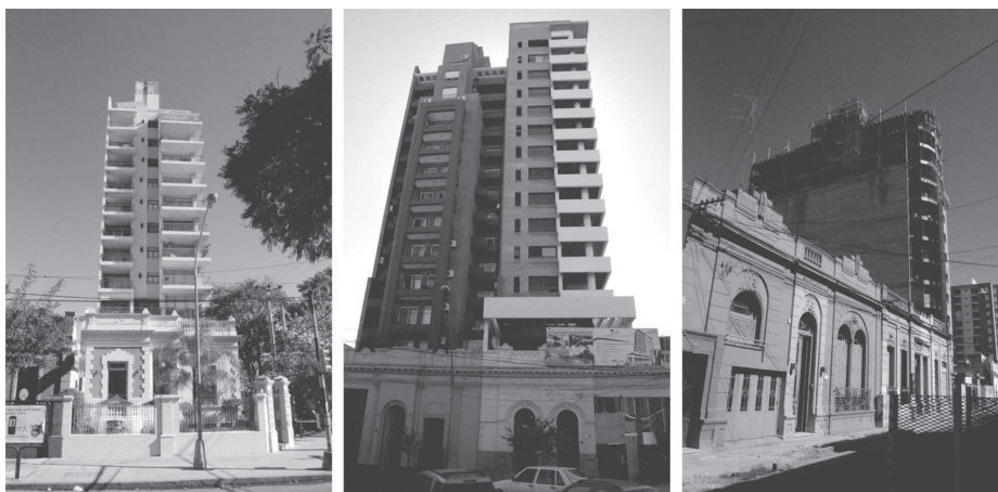
Figura 7. Edificios de vivienda colectiva en altura construidos en viviendas unifamiliares de valor arquitectónico patrimonial

3 Sancionada en 1996. Sus modificatorias: N.º 10.798/01 y N.º 10.829/02.