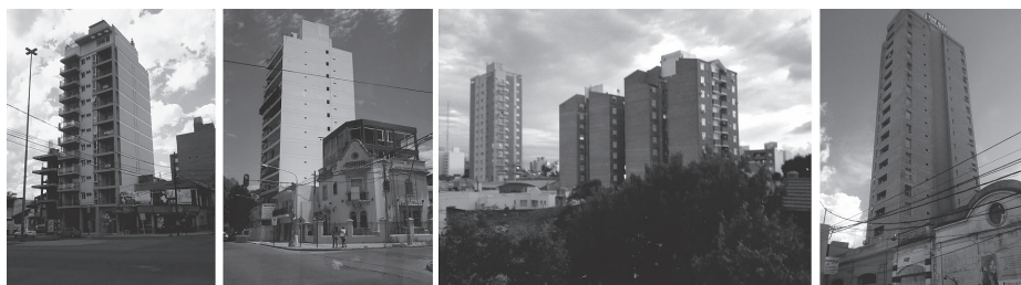
Figura 4. Medianeras de la verticalización del NUC santafesino

Esto pone en evidencia que la mayoría de las operaciones inmobiliarias tienen un peso tal en el desarrollo urbano, que ya tienen modelos tipológicos que han sido probados innumerables veces y que resultan rentables como negocio. Estos ocupan la parcela al máximo para sacar el mayor aprovechamiento del suelo y que eso se traduzca en mayor cantidad de departamentos para la venta y así lograr el recupero del capital invertido en el menor tiempo posible. Este mercado inmobiliario hace que muchas veces la distinción entre un edificio y otro se dé sobre la base de su localización dentro de la trama, lo que lleva a que los departamentos se hayan convertido en un producto de características industriales, desde el proyecto hasta la construcción.