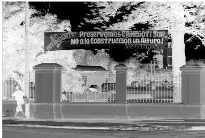
Figura 6. Pasacalle de reclamo de los vecinos de Barrio Candiotti Sur

vecinos es que la voracidad inmobiliaria condiciona enormemente la dinámica del crecimiento de la ciudad, a pesar de medidas bien intencionadas tomadas por la última gestión municipal por regular la práctica". Agregan que ello es visible en Candiotti Sur, barrio con "una marcada identidad histórica ligada al desarrollo del ex Ferrocarril Francés y al Puerto de Ultramar, definido por construcciones bajas de alta riqueza arquitectónica con una densidad poblacional media-baja". 2