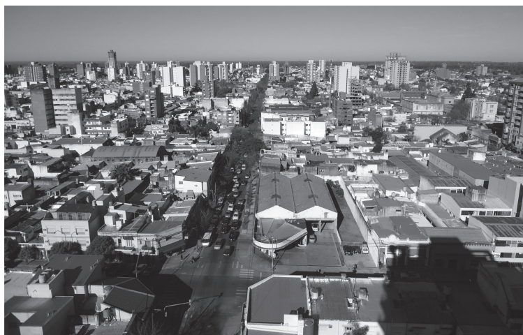
Figura 3. Formas de la verticalización hacia el sur del NUC, 2013