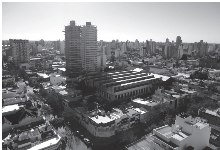
Figura 2. Formas de la verticalización hacia el noreste del NUC, 2013