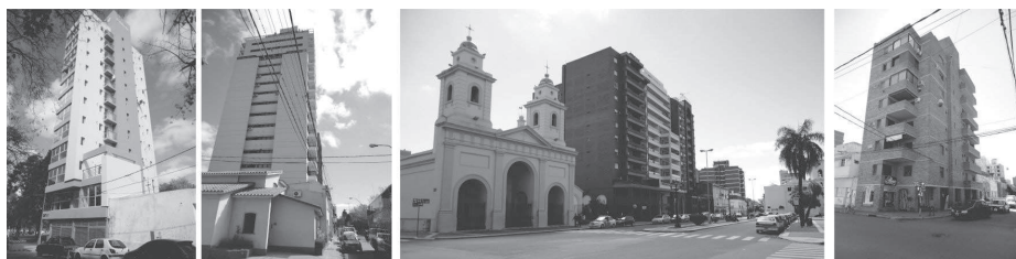
Figura 5. Edificios de vivienda colectiva en altura en Santa Fe

Actualmente, las constructoras apuestan a la singularidad a partir de los amenities . Los edificios de vivienda en altura de alta gama, apuntados a un mercado con mayor poder adquisitivo, incorporan como elemento diferencial balcones de superficies generosas, gimnasios, salón de usos múltiples, mayor cantidad de ascensores, terrazas con piletas, terminaciones de primera calidad, sistemas de calefacción centralizados, sistemas de refrigeración ya incorporados, aberturas con doble vidriado hermético, entre otras prestaciones y servicios.