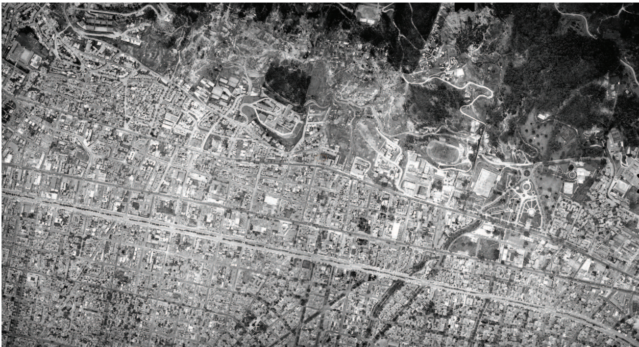
Figura 4 Aerofotografía de la zona de los cerros orientales donde se ubicaron las antiguas barriadas informales

Este es el caso de los barrios El Paraíso, San Martín de Porres, Pardo Rubio Nororiental y Barrocolorado, este último también conocido como Mariscal Sucre, asentamientos contruidos de manera informal por familias trabajadoras de las industrias extractivas de los cerros orientales del norte de la ciudad, quienes vivieron durante varias décadas al margen del desarrollo urbano, pero que por iniciativa propia —aunque con incidencia de agencias como partidos políticos, movimientos de izquierda, organizaciones no gubernamentales y organizaciones sociales— se constituyeron en barrios con una organización consistente. Su ubicación en los cerros orientales los convirtió en el blanco de todo tipo de disputas, desde aquellas que veían dichos terrenos para la urbanización de vivienda de alto costo, hasta las que propusieron proyectos urbanísticos tan importantes como la construcción de