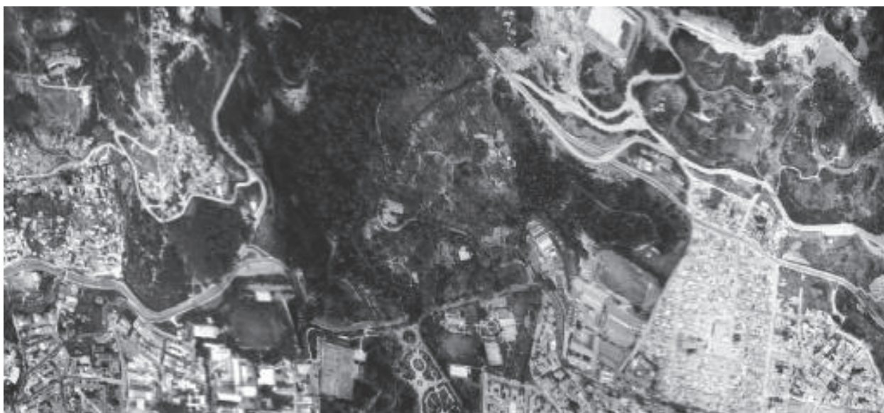
Figura 5 Barrio El Paraíso

Uno de los primeros barrios obreros de la cuenca alta del río Arzobispo fue El Paraíso. Sus orígenes se remontan a finales del siglo XIX sobre los terrenos de la entonces hacienda El Paraíso, propiedad de la familia Murillo. Sus terrenos, ubicados en una próspera zona extractiva que se tendía entre los cerros orientales y la hacienda La Merced y entre el río Arzobispo y la quebrada de Barrocolorado, permitieron la explotación de arena y carbón, con lo cual sus propietarios consintieron el asentamiento de familias como mano de obra necesaria. Con el paso de los años, cuando se dieron por terminadas las industrias extractivas de los cerros orientales, parte de la hacienda fue vendida a otras familias, pero los ocupantes preservaron sus viviendas en la parte alta del cerro.